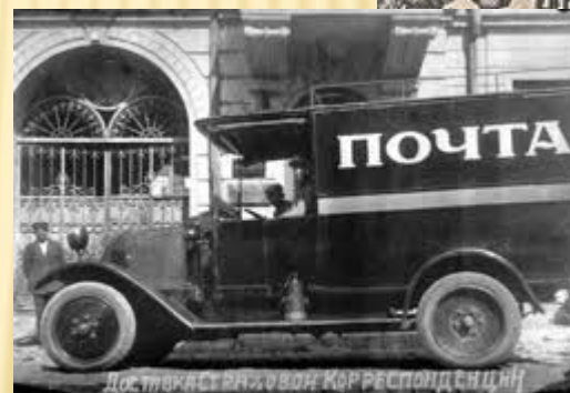
Почтовая машина 30-х г.г. XX века.