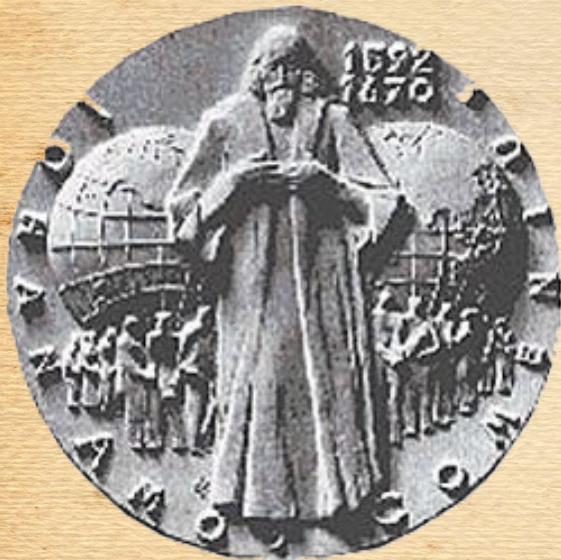
Медаль Яна Амоса Коменского (серия 1992 года выпуска)

Поэтому нужно серьёзно позаботиться о том, чтобы в школах для всего, что приходится делать, были истинные, точные, простые, легко понимаемые, лёгкие для подражания примеры и образцы всех вещей, или руководящие правила и примерные упражнения в работах. И тогда только не будет ничего неразумного требовать от того, кому показан свет, чтобы он видел, от того, кто уже твёрдо стоит на ногах, чтобы он ходил, от того, кто умеет обращаться с инструментами, чтобы он работал.