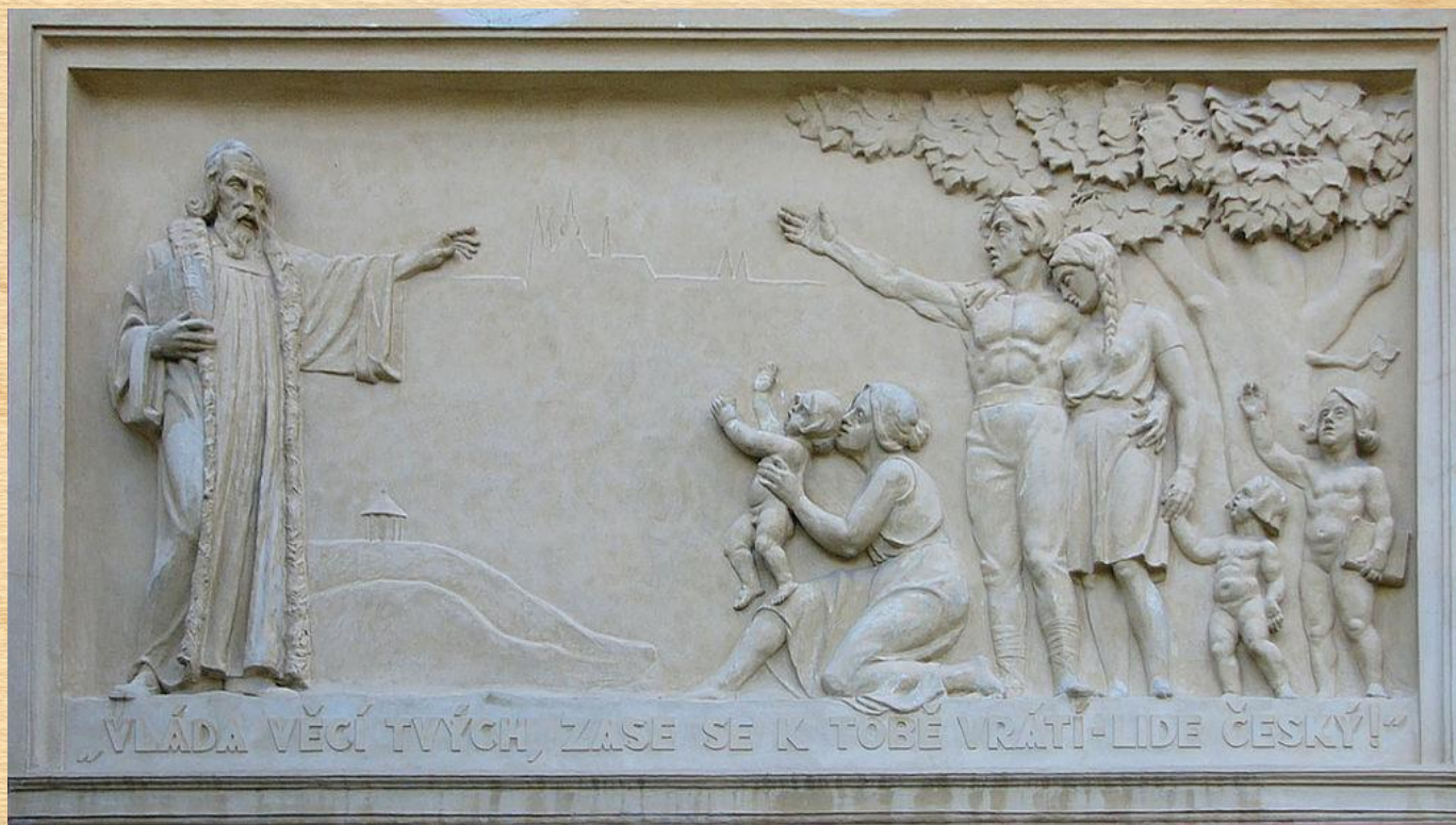
Изображение Коменского на барельефе, украшающем здание школы в Долани (Чехия)

Обучение рисованию в художественной школе начиналось с копирования образцов, и в общеобразовательной школе, считает Коменский, должна быть эта же система, причем образцы должны подбираться самые лучшие (имелись в виду произведения великих художников), «формы для выполнения должны быть самыми совершенными»