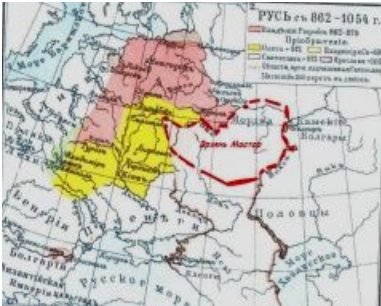
Эрзянь Мастор – Пургасова Русь