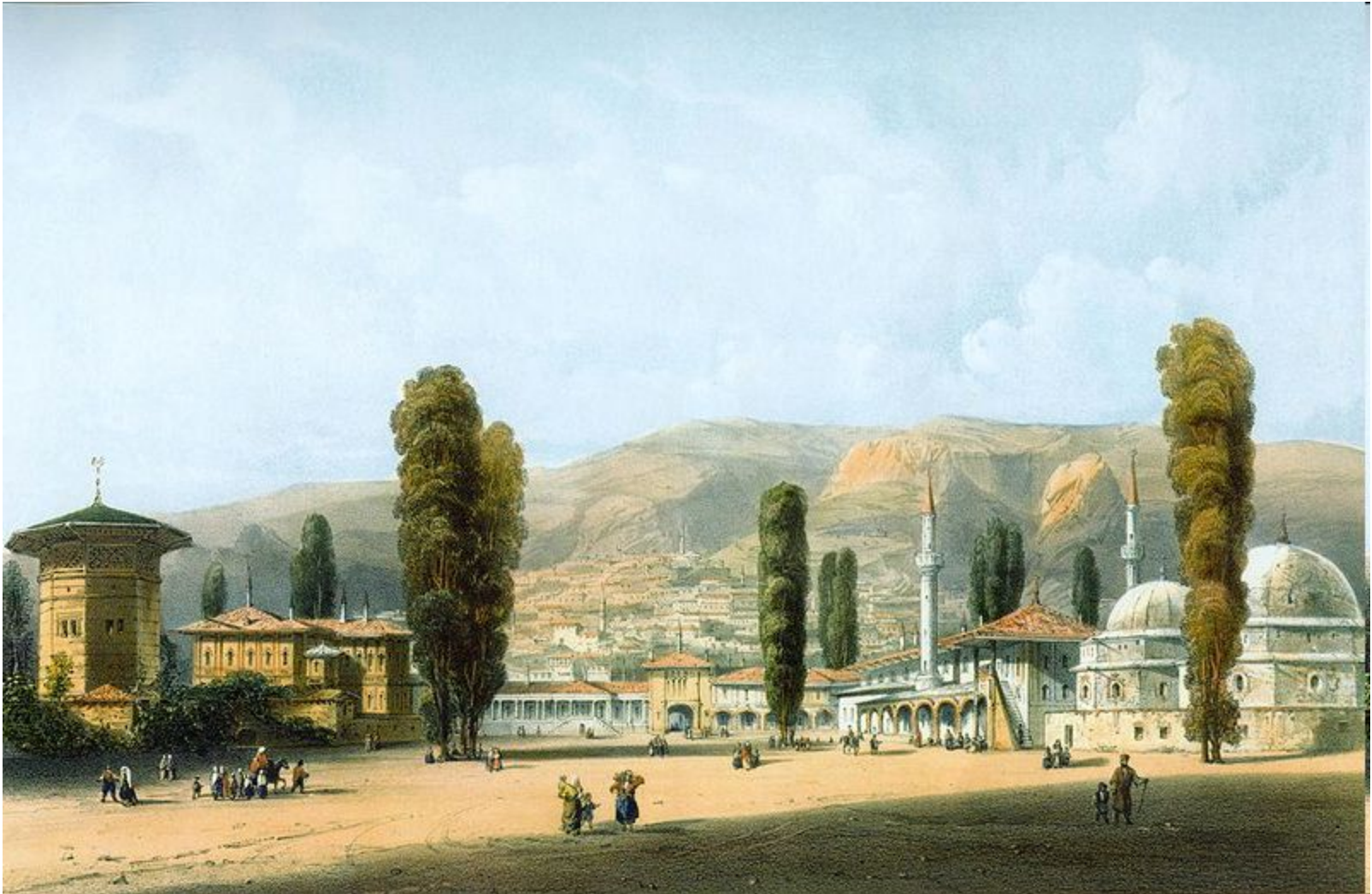
Карло Боссоли 1840-1842гг Бахчисарай.

Наиболее значительными из них были Бахчисарай — столица Крымского ханства.