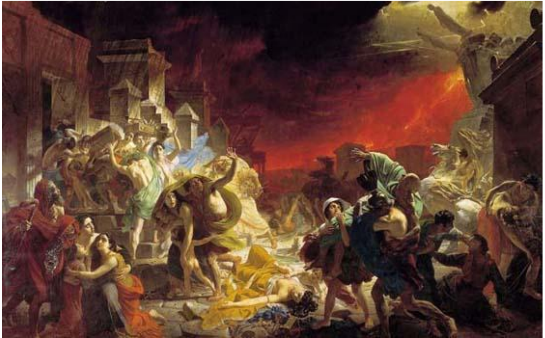
К.П. Брюллов «Последний день Помпеи»