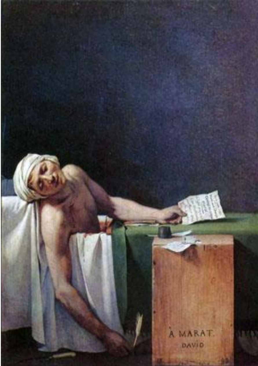
Давид «Смерть Марата»