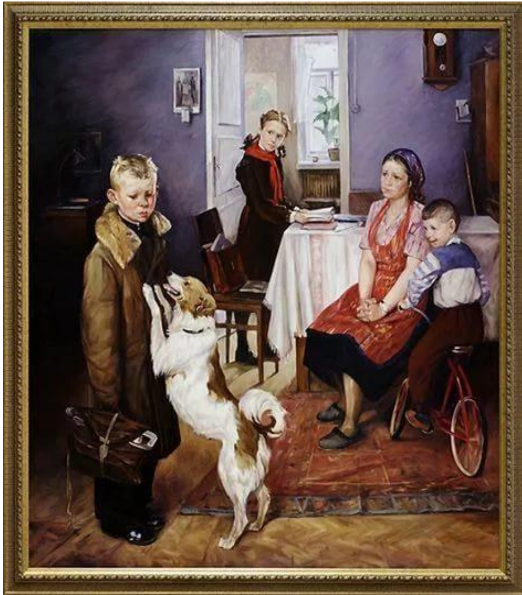
Ф.Решетников «Опять двойка»