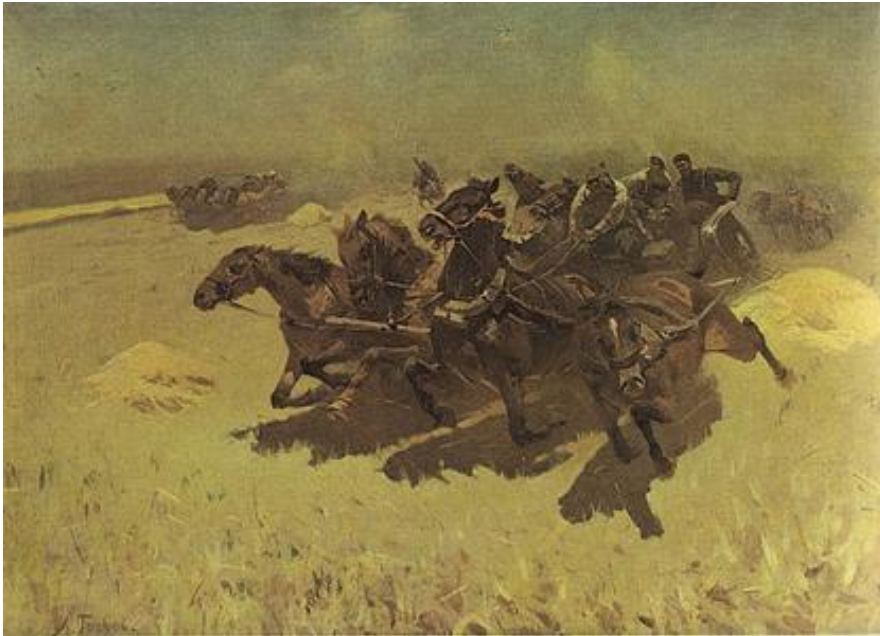
М.Б. Греков «Тачанка»