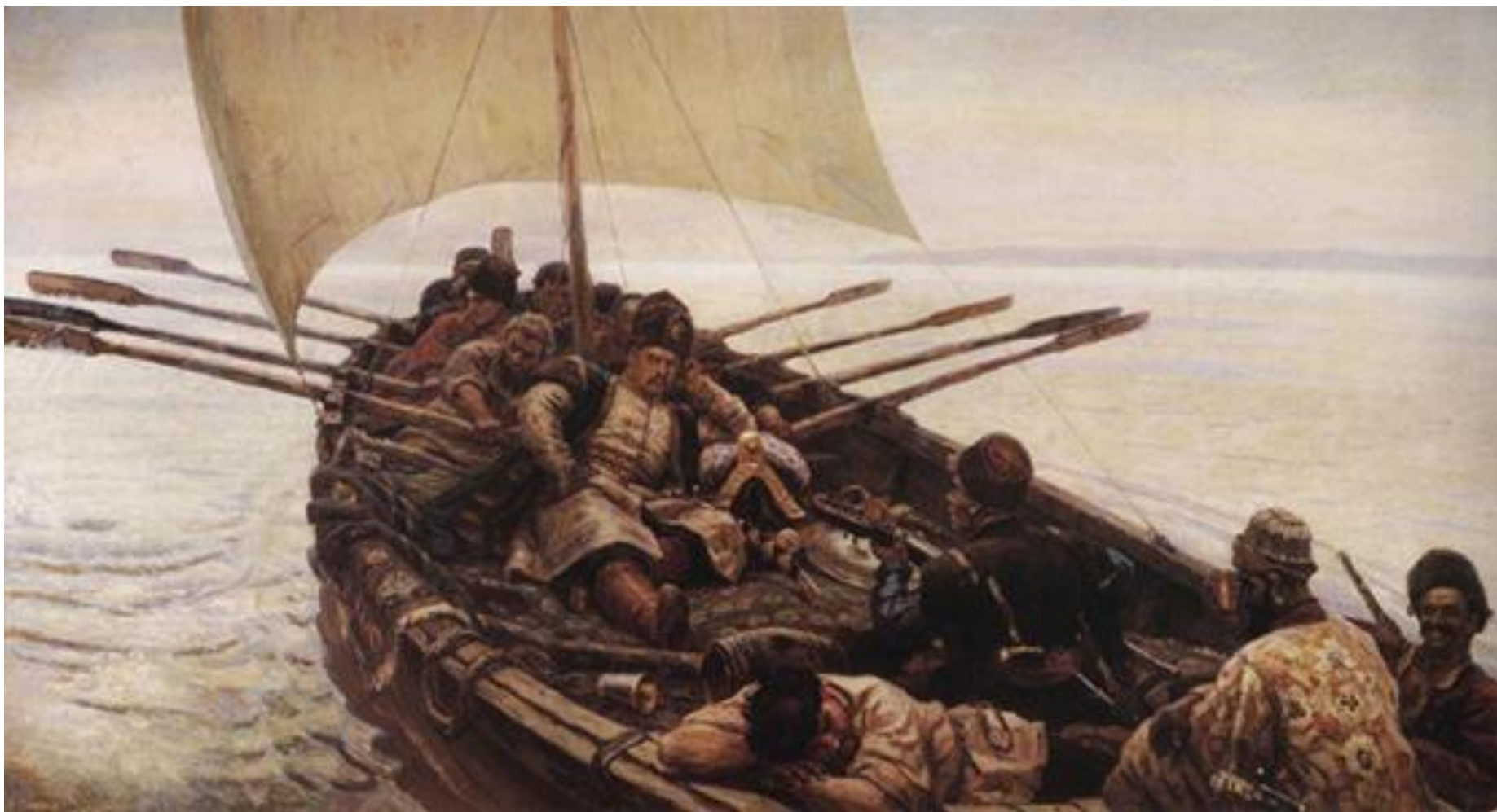
В.И. Сурикова «Степан Разин»