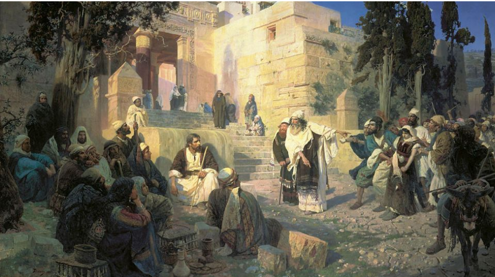
В.Д. Поленов «Христос и грешница»