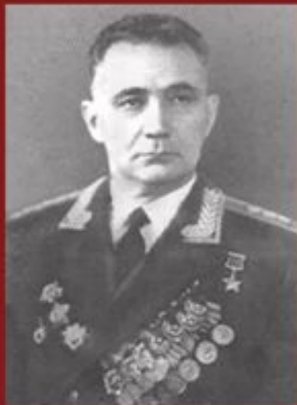
Хаджи-Умар Мамсуров (полковник Ксанти)