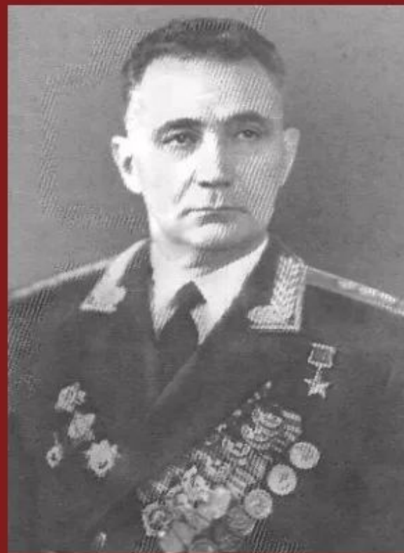
Хаджи-Умар Мамсуров (полковник Ксанти)