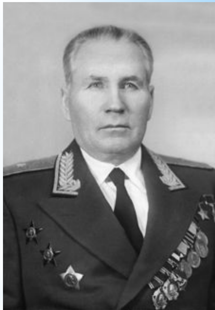
Иван Иванович Фесин