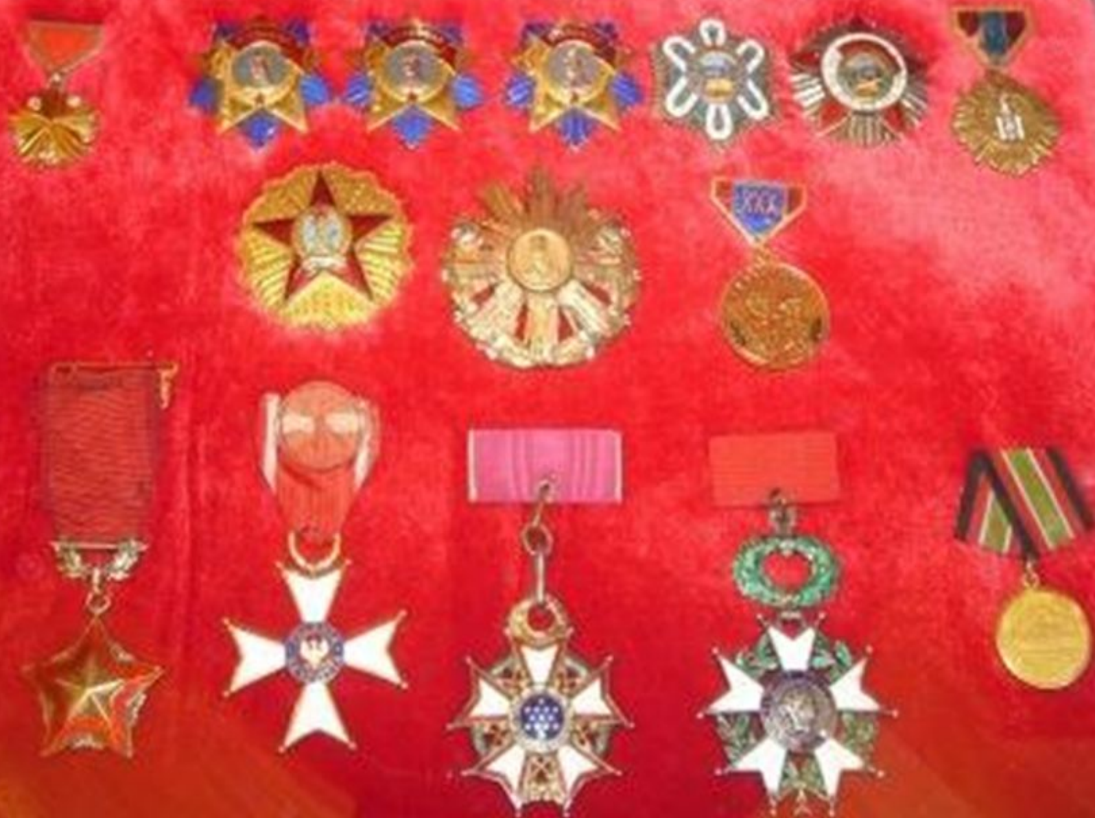
Зарубежные награды И.А.Плешева