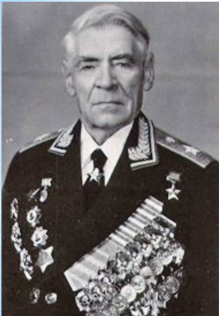
Хетагуров Георгий Иванович