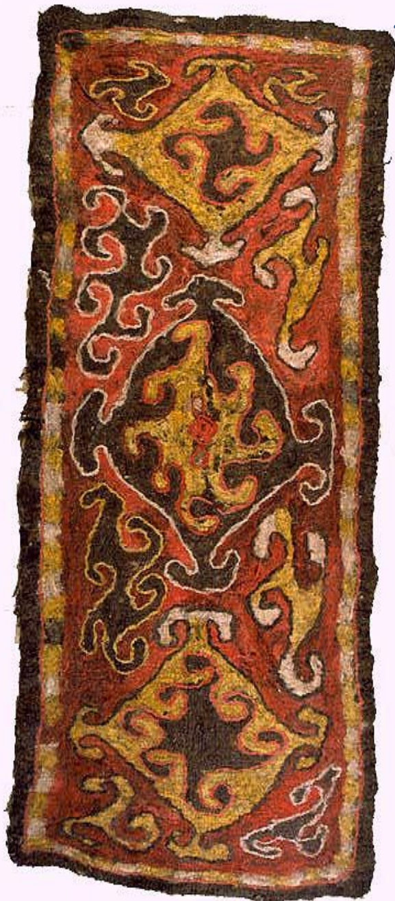
← Войлочный ковер «Текенет»