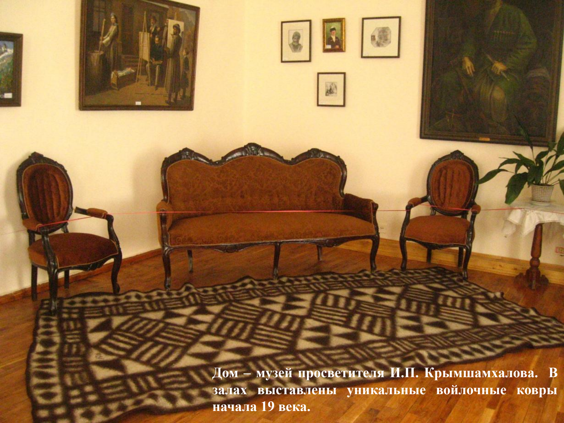
Дом – музей просветителя И.П. Крымшамхалова. В залах выставлены уникальные войлочные ковры начала 19 века.