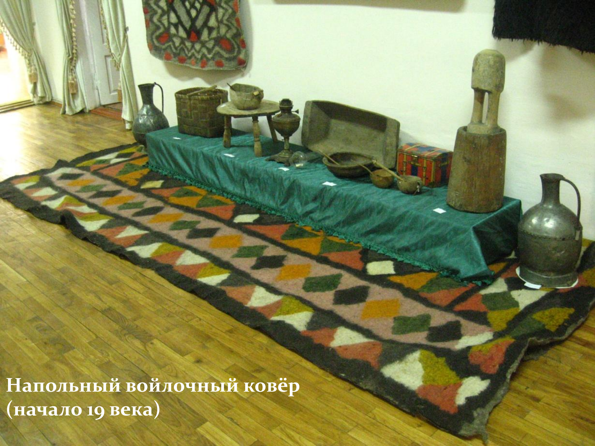
Напольный войлочный ковёр (начало 19 века)