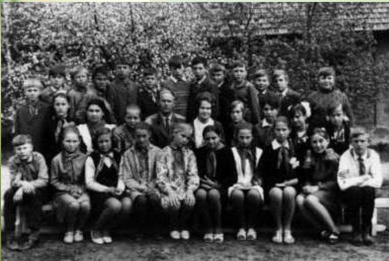
выпуск павлышской школы им Сухомлинского 1978г.

Подготовка детей пяти-шестилетнего возраста к школе получила широкое развитие через детские сады, и посредством организации подготовительных групп при начальных школах, драгоценный опыт Павлышского учителя заслуживает самого внимательного изучения.