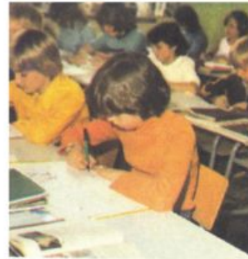
Школьники на занятиях