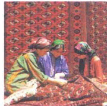
Ковровщицы за работой