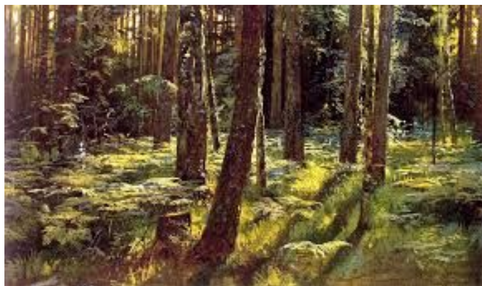
«Дождь в дубовом лесу»