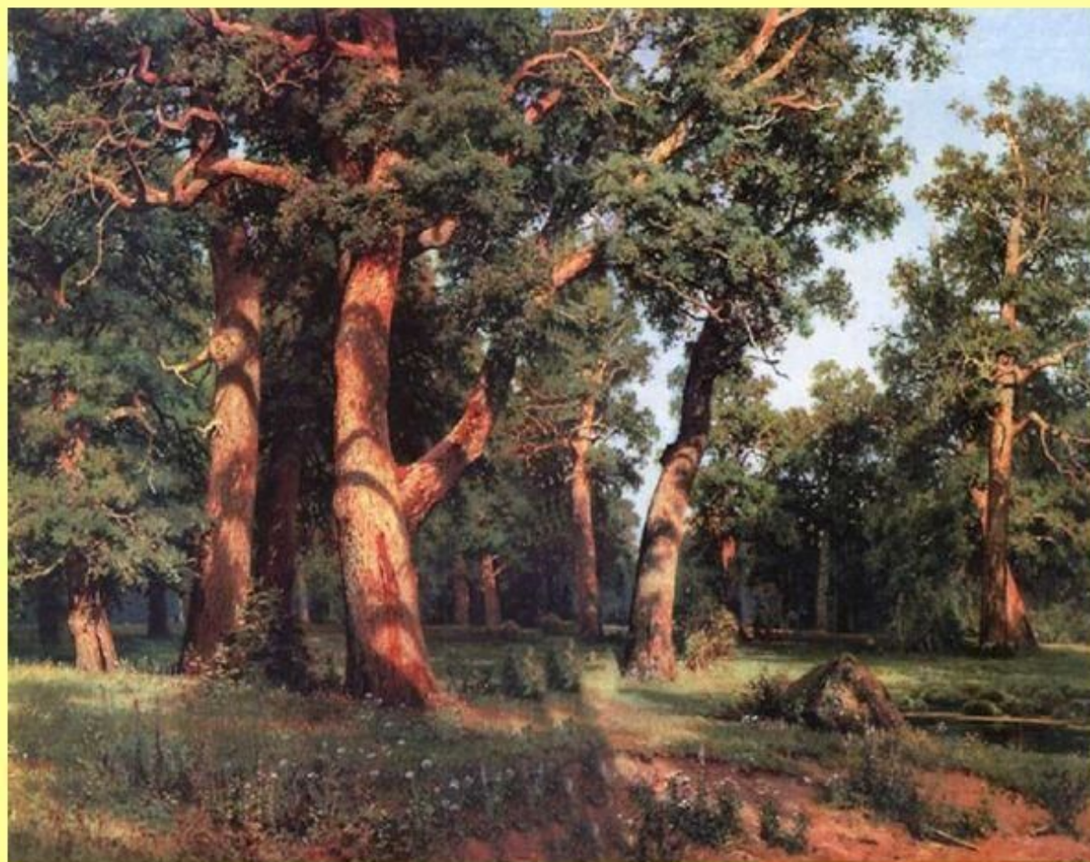
Дубовая роща. 1887. Масло.

Иван Иванович Шишкин родился в 1832 году в городе Елабуга, который расположен в нашей республике, всего в ста шестидесяти километрах от Казани. Он один из самых известных русских пейзажистов. Шишкин хорошо знал русскую природу и очень ее любил.