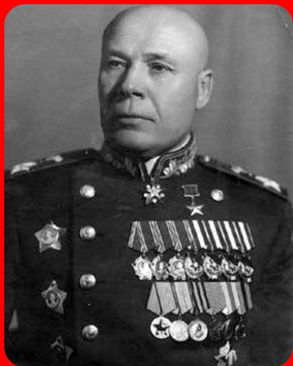
Семён Константинович Тимошенко

(позже была преобразована в СТАВКУ ВЕРХОВНОГО КОМАНДОВАНИЯ)