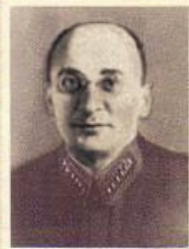
Л. П. БЕРИЯ