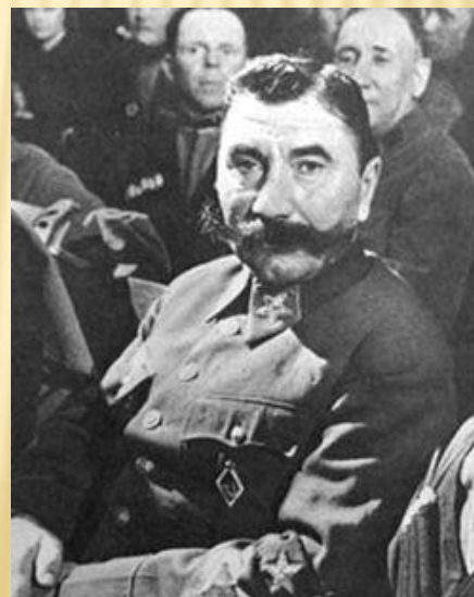
Семён Михайлович Будённый

Первые заседания Ставки Главного Командования Вооружённых сил в июне проходили без Сталина. Председательство наркома обороны СССР маршала С. К. Тимошенко было лишь номинальным.