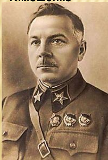
Климент Ефремович Ворошилов

Первые заседания Ставки Главного Командования Вооружённых сил в июне проходили без Сталина. Председательство наркома обороны СССР маршала С. К. Тимошенко было лишь номинальным.