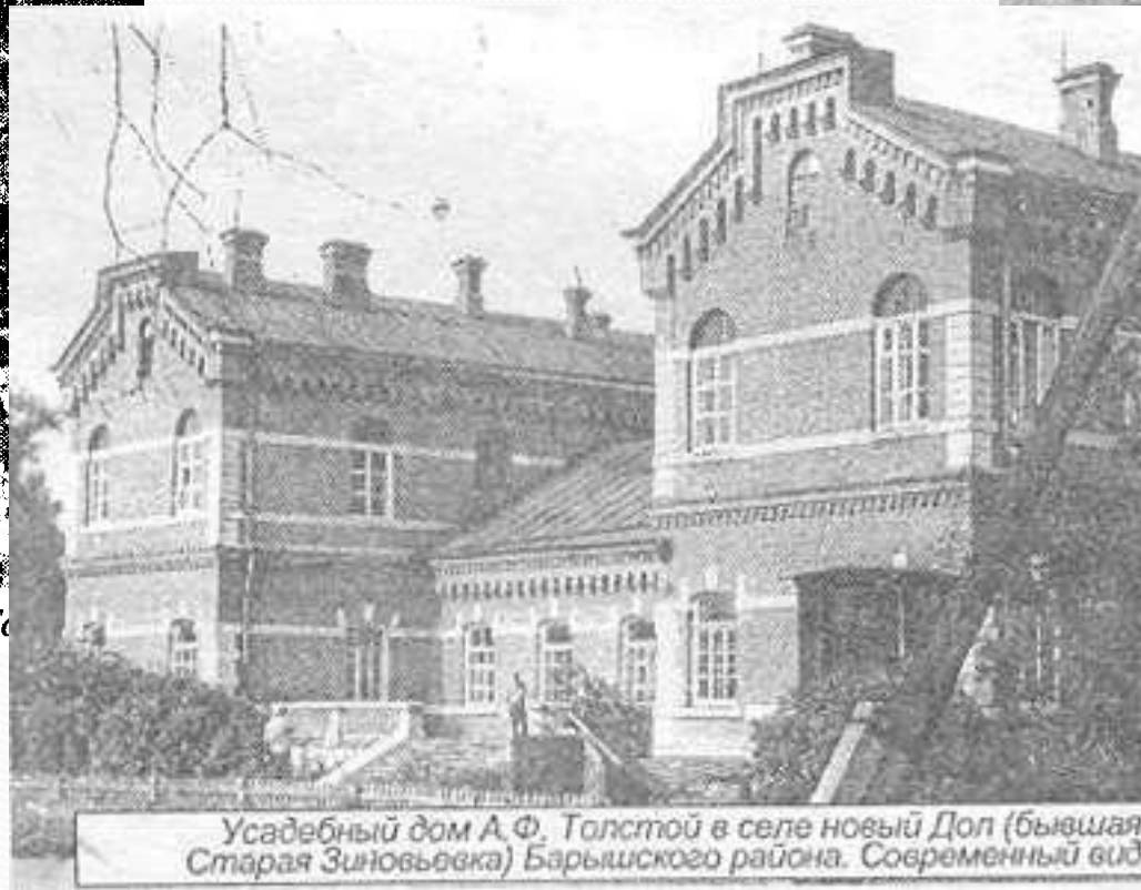
Усадебный дом А. Ф. Толстой в селе новый Дол (бывшая Старая Зиновьевка) Барышского района. Современный вид