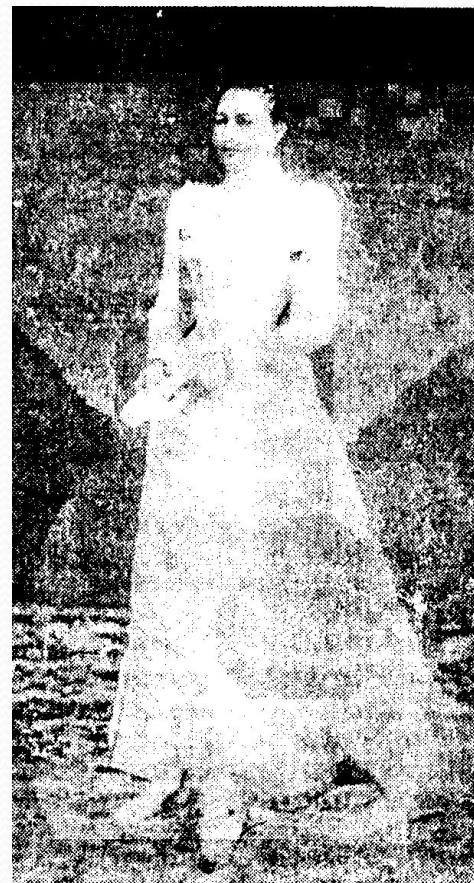
А. Ф. Толстая.