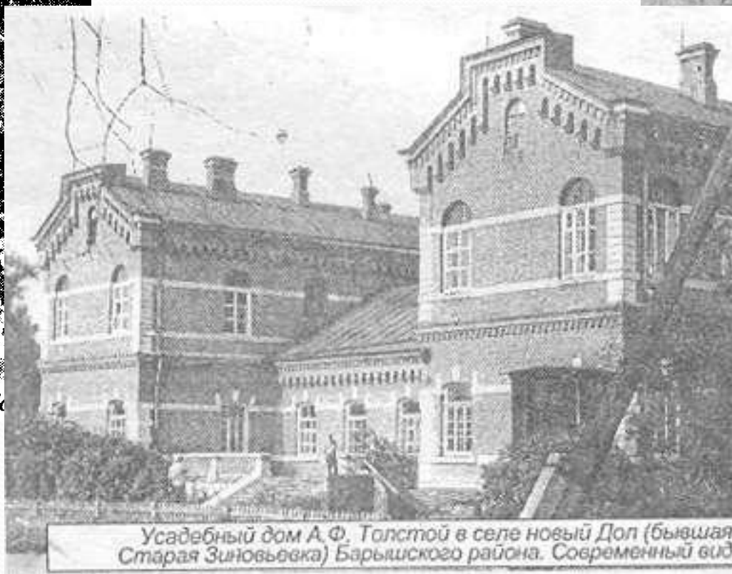
Усадебный дом А. Ф. Толстой в селе новый Дол (бывшая Старая Зиновьевка) Барышского района. Современный вид