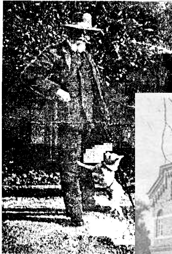
А. Ф. Толстой