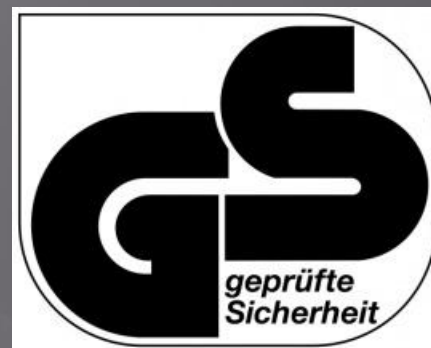
Знак GS-mark. "Geprüfte Sicherheit", "German Standard"