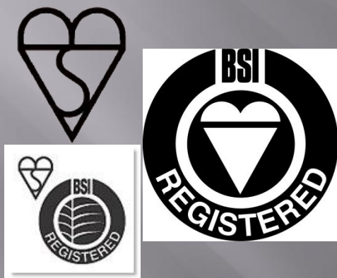
Знак BSI. "British Standards Institution"