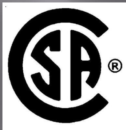
Знак CSA. (Canadian Standard Association).