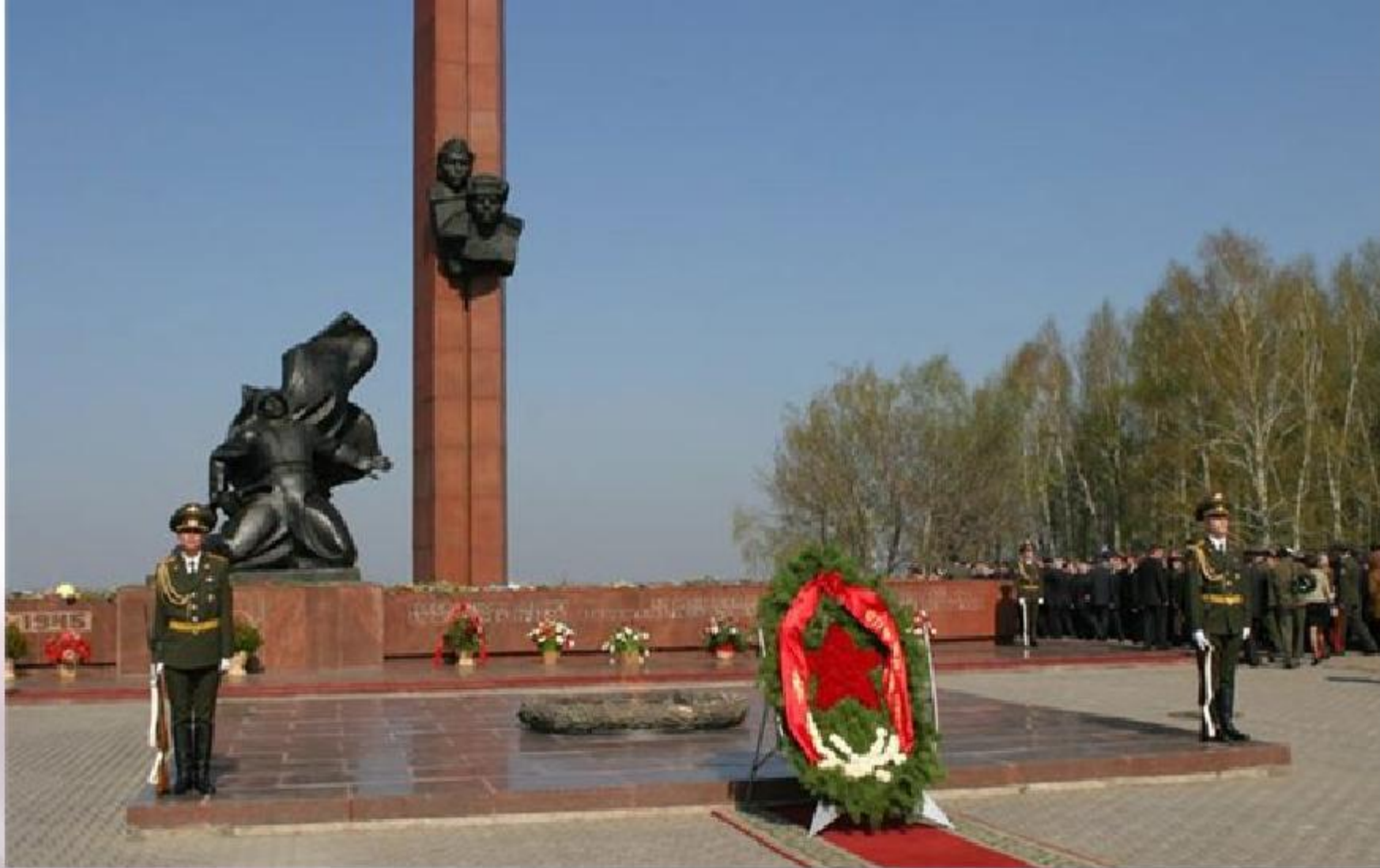
Памятник А. Матросову и М. Губайдуллину