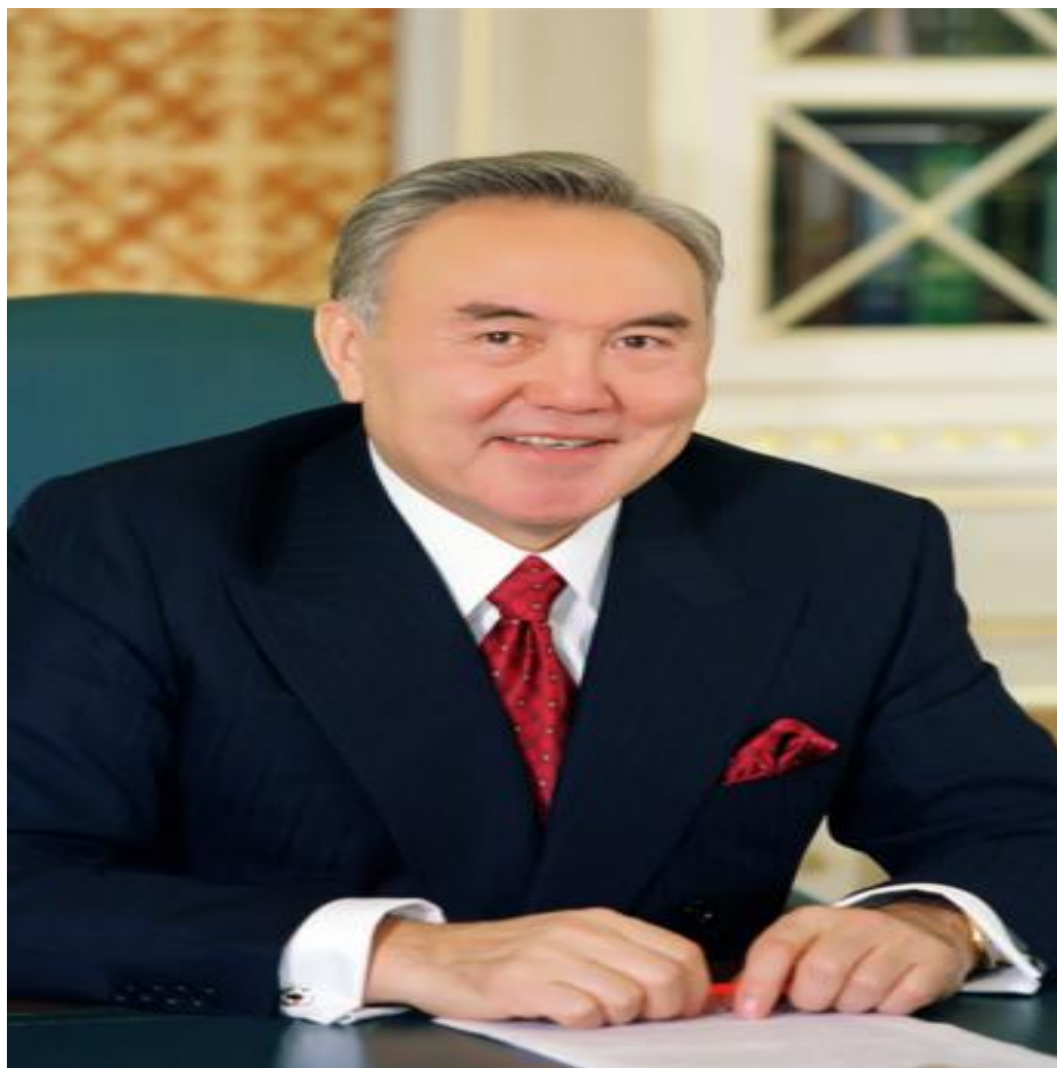
Елбасы – президент: Нұрсұлтан Әбіш ұлы Назарбаев