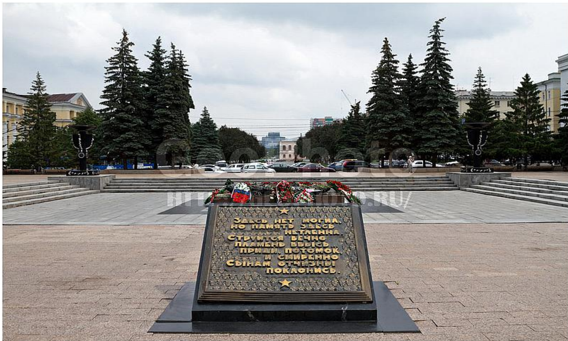
# pdkr211100002 Chelyabinsk, Ural, Russia