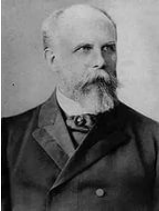
Вильгельм Прейер 1841-1897

Наука о психическом развитии ребёнка детская психология – зародилась как ветвь сравнительной психологии в конце 19 века. Точкой отсчёта для систематических исследований психологии ребёнка служит книга В. Прейера «Душа ребёнка».