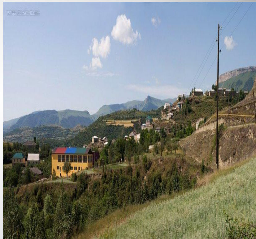
Урахи Верхнее село хъарша Нижнее село хъарша