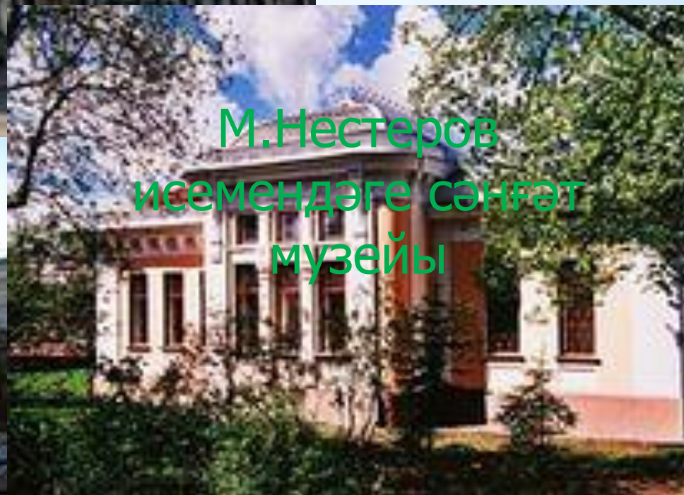
М.Нестеров исемендәге сәнғәт музейы