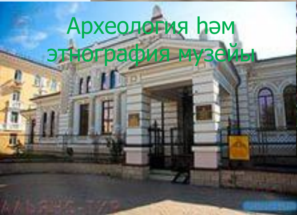
Археология һәм этнография музейы