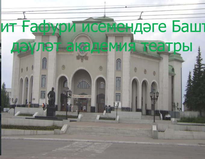
Рус дәүләт академия драма театры