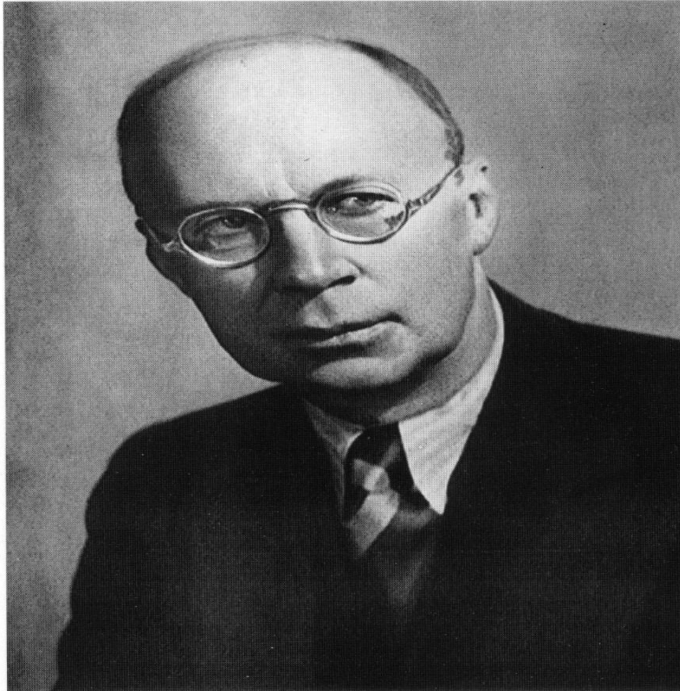
— SERGE PROKOFIEV —