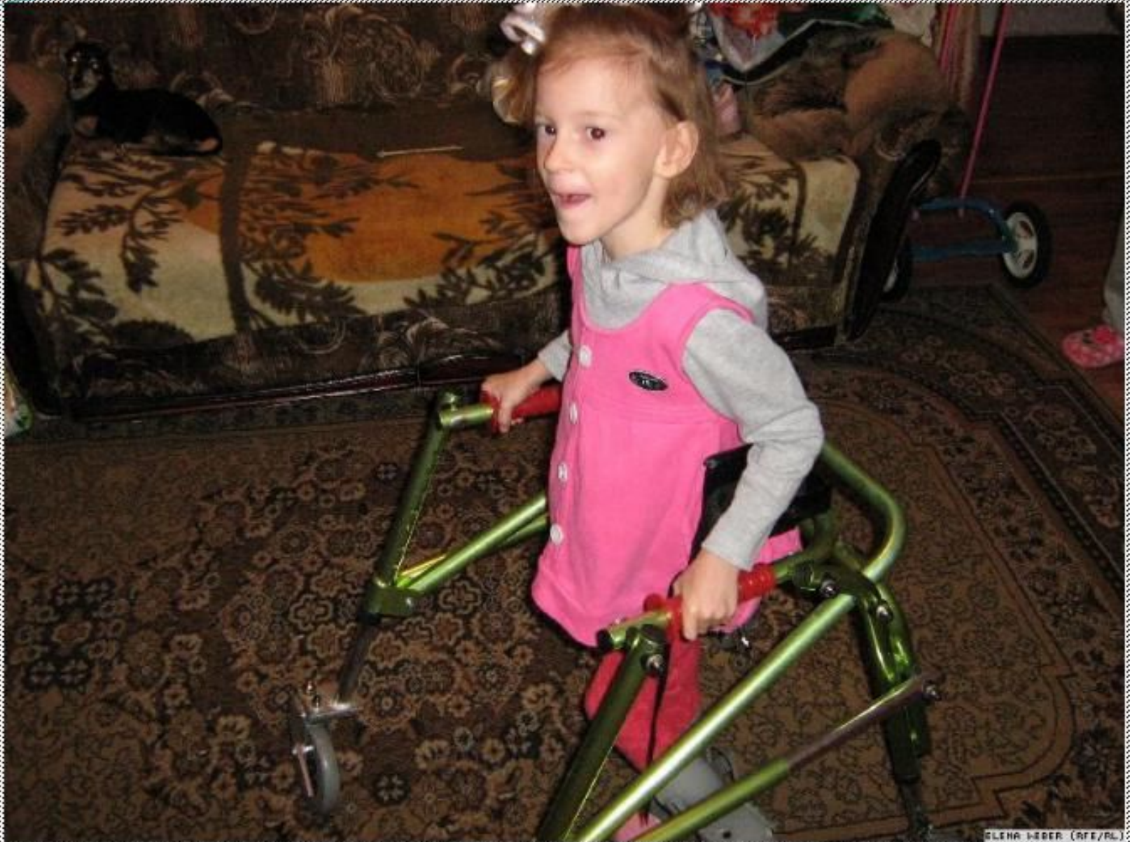
ELENA WEBER (RFE/PL)