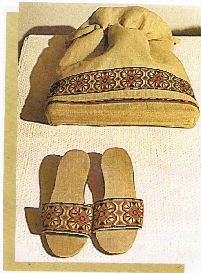
Пляжний гарнітур, рядовина, хрестик, 1979 р.