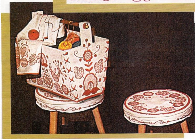
Чохли на стілець, кошик для рукоділья, парусина, полтавська гладь, рушничний шов, 1974 р.