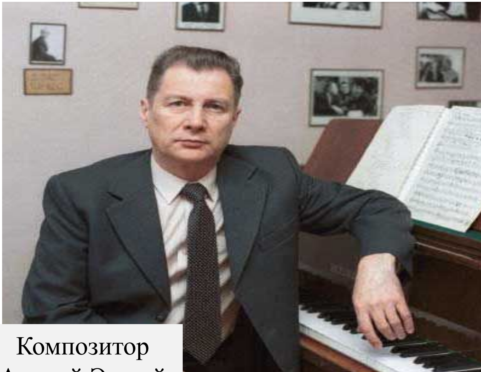
Композитор Андрей Эшпай