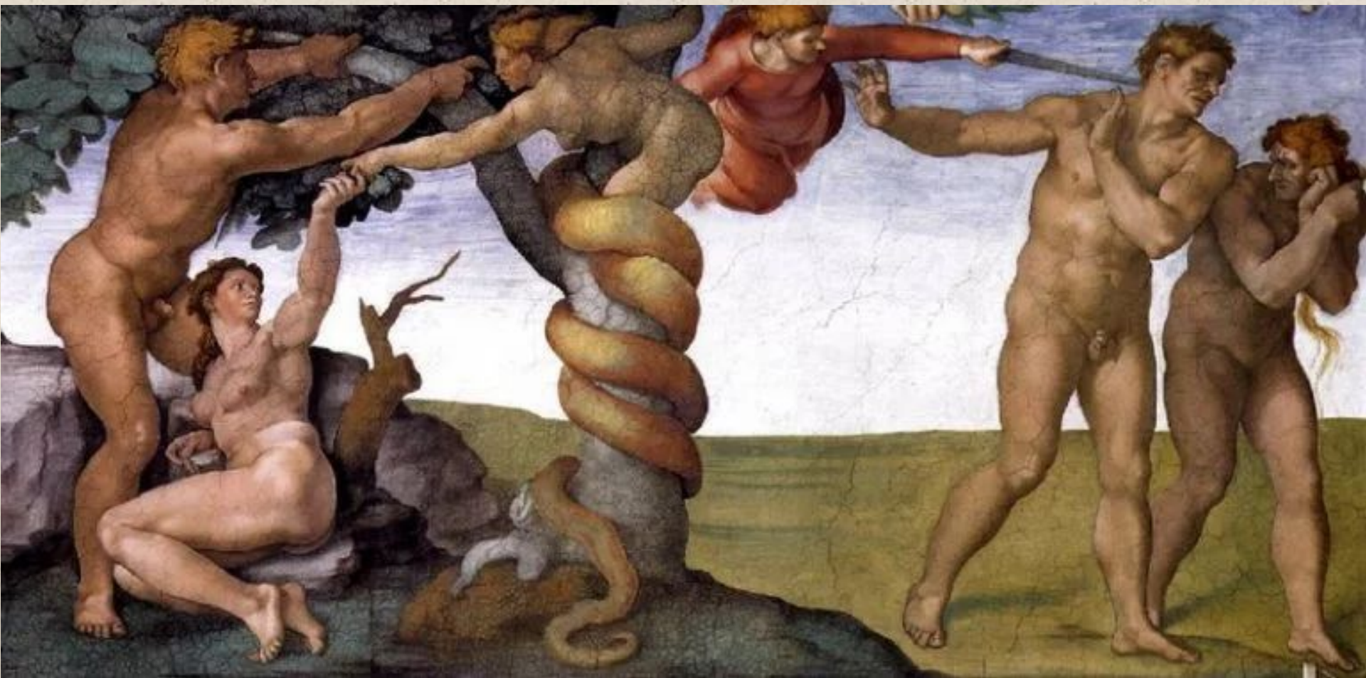
Микеланджело Буонарроти «Грехопадение и изгнание из Рая»