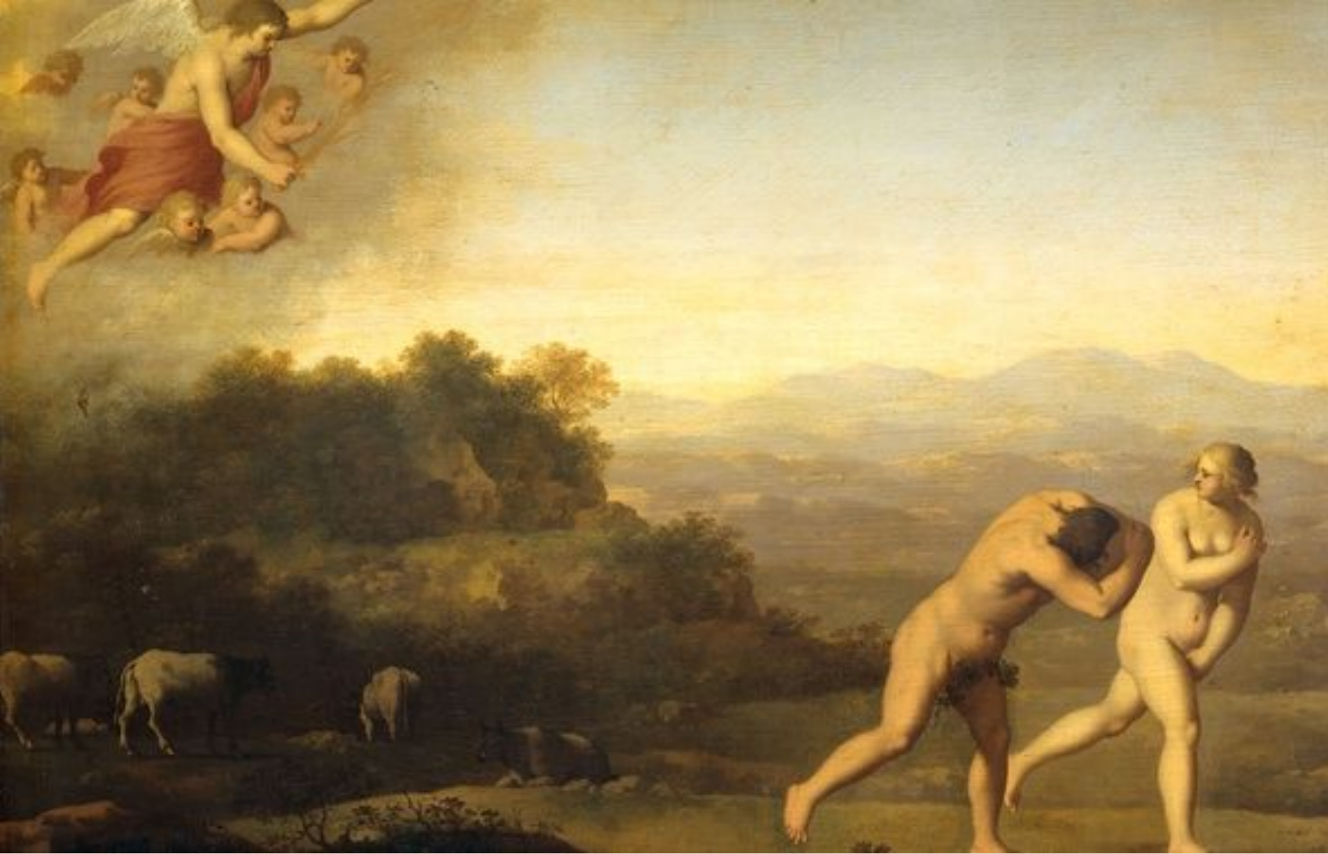
Изгнание из Рая, Корнелис ван Пуленбург