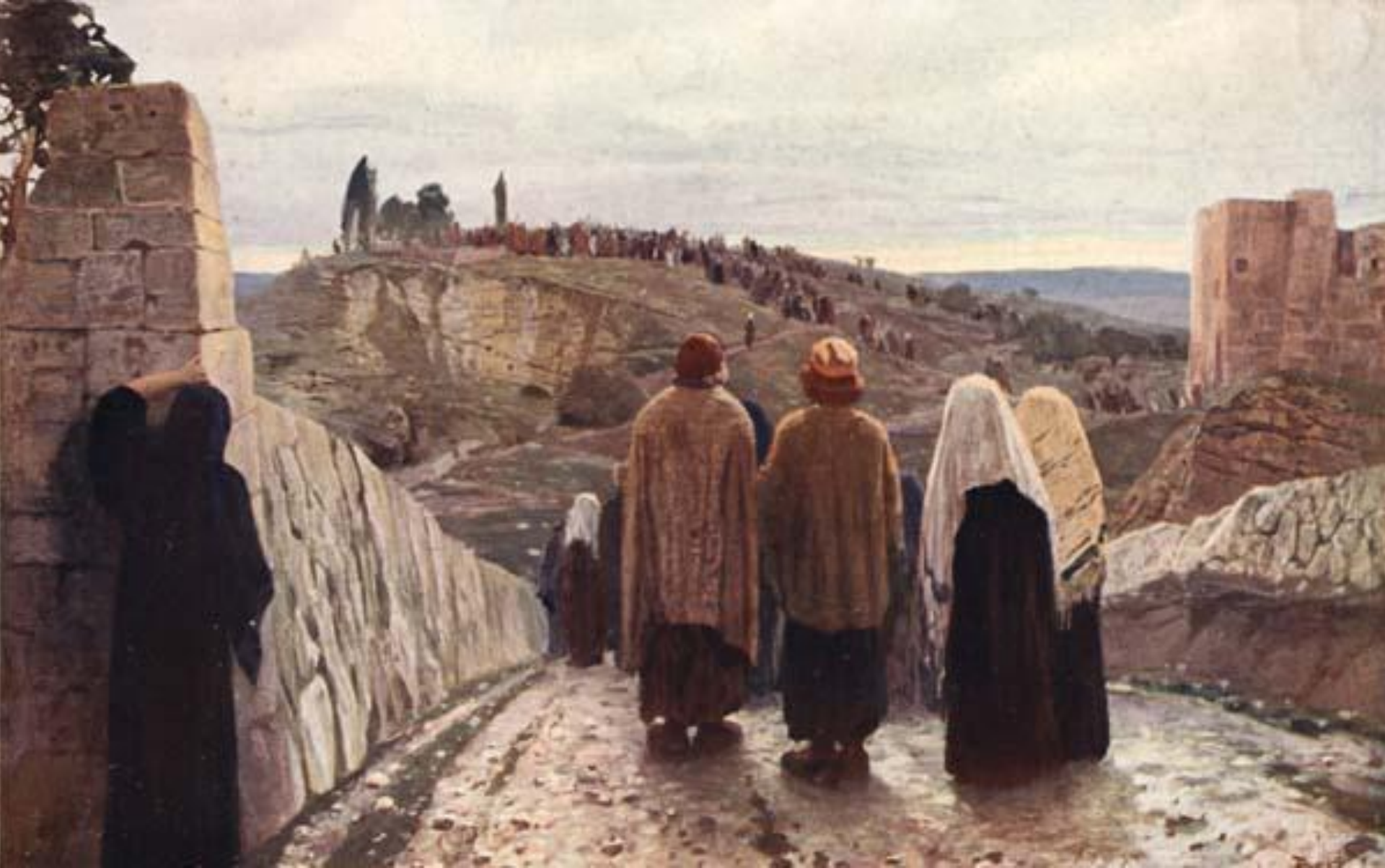
Вошли на Голгофу. В.Д. Поленов