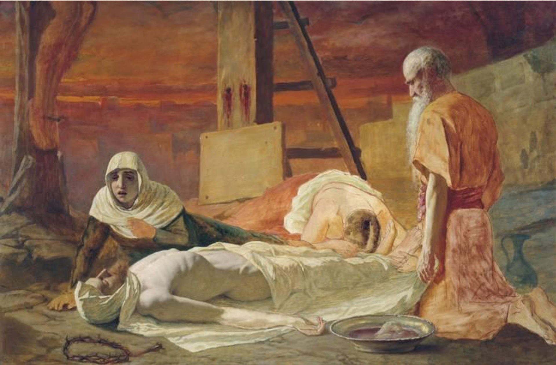
В. Г. Перов. Снятие с креста