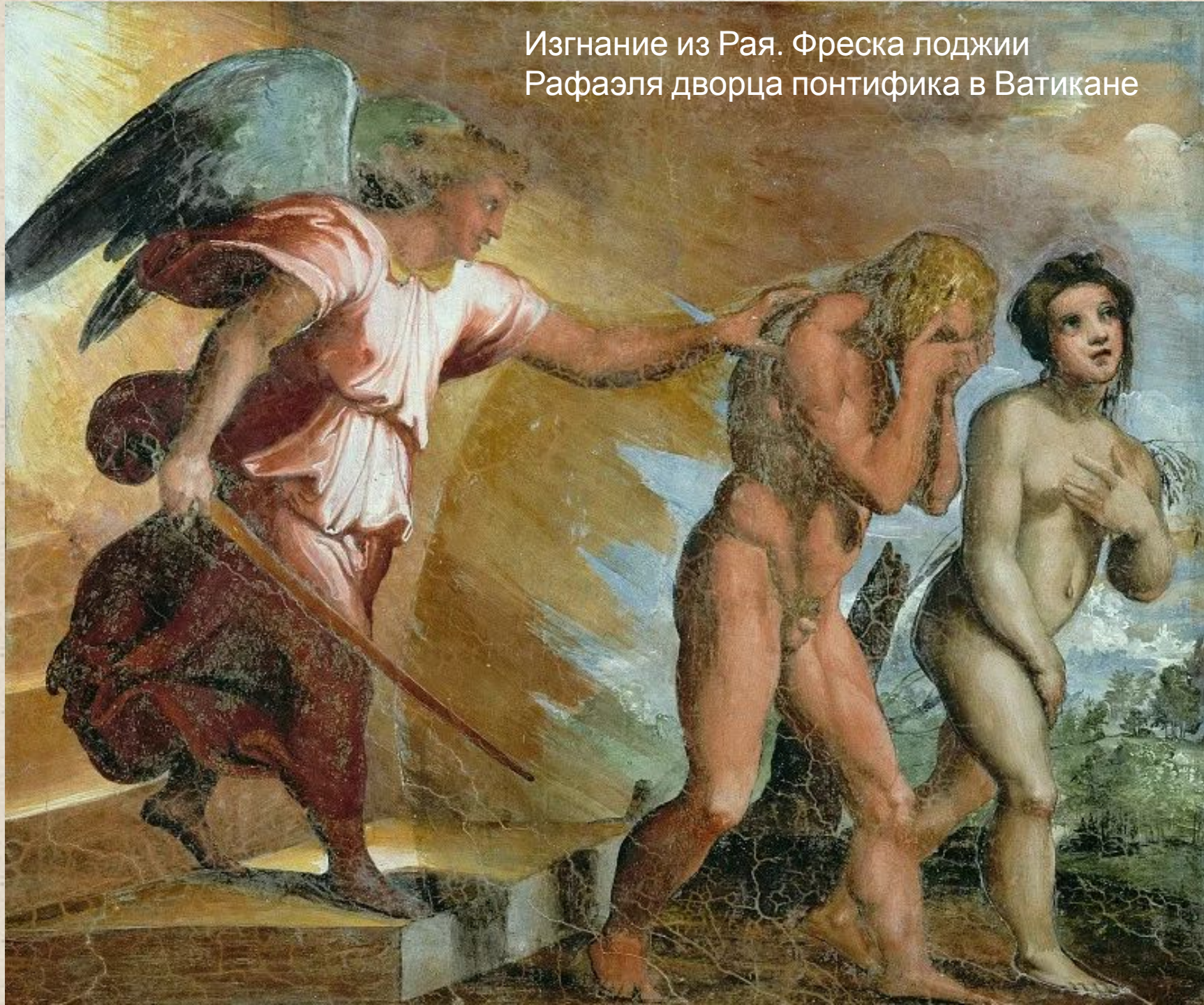
Изгнание из Рая. Фреска лоджии Рафаэля дворца понтифика в Ватикане