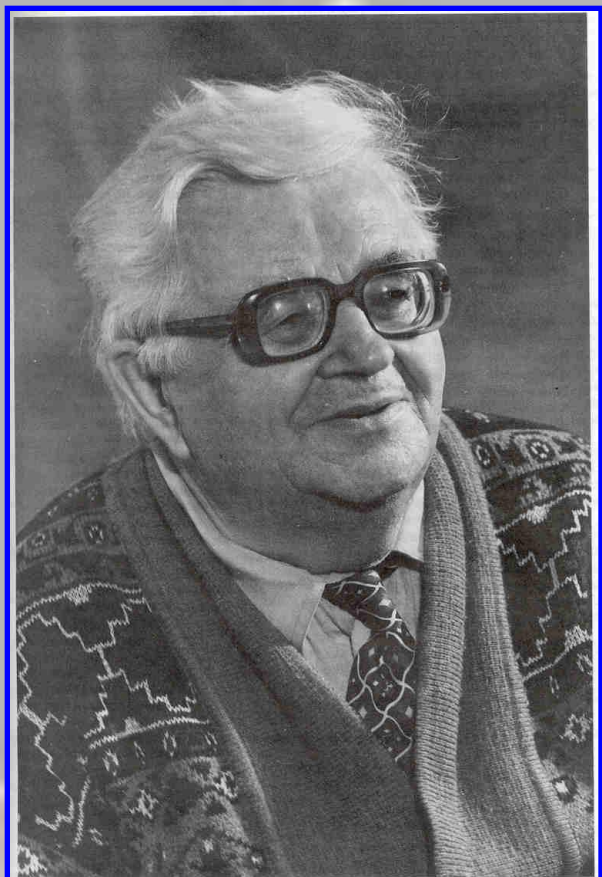
Валентин Дмитриевич Берестов