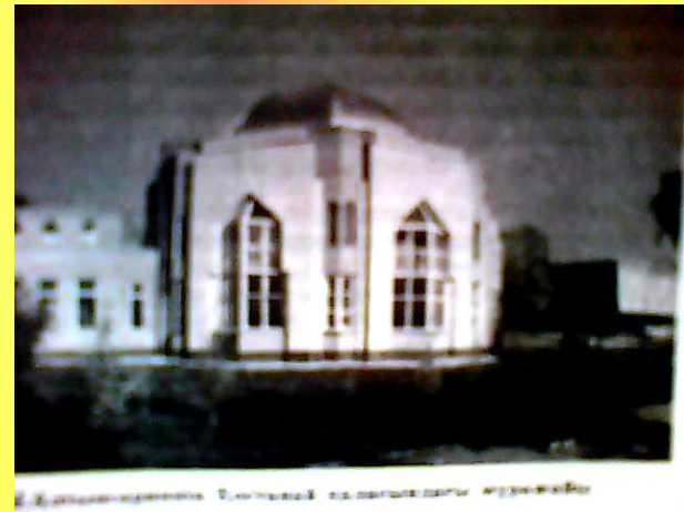
Қостанай қаласында Ы. Алтынсариннің мұражайы