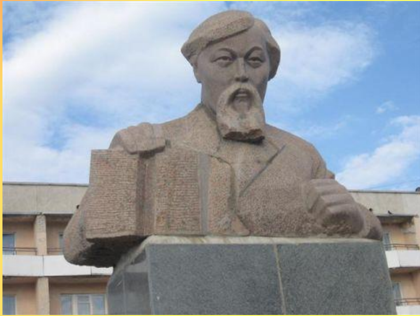
Қостанай қаласында орналақан ескірткіші