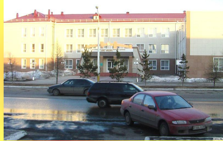
Қостанай қаласында Ы. Алтынсарин атындағы мектебі