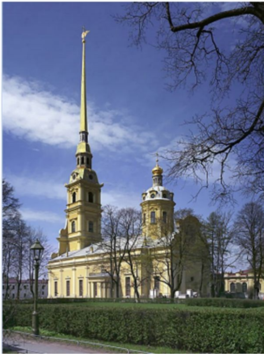
Колокольня Петропавловского собора в крепости