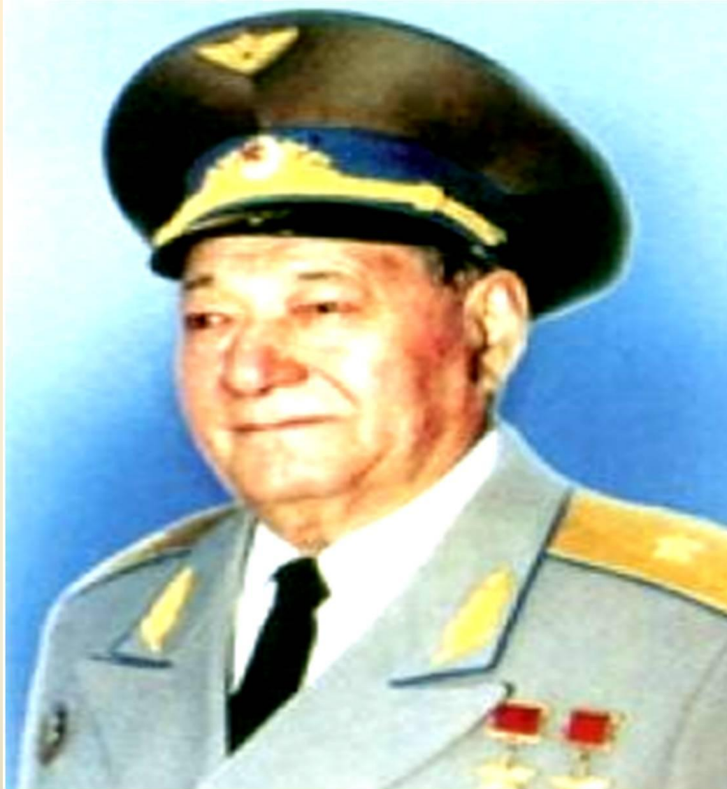
ТАЛҒАТ БИГЕЛЬДИНОВ ЕКІ МӘРТЕ КЕҢЕС ОДАҒЫНЫҢ БАТЫРЫ АВИАЦИЯ ГЕНЕРАЛ-МАЙОРЫ (1922-2014)