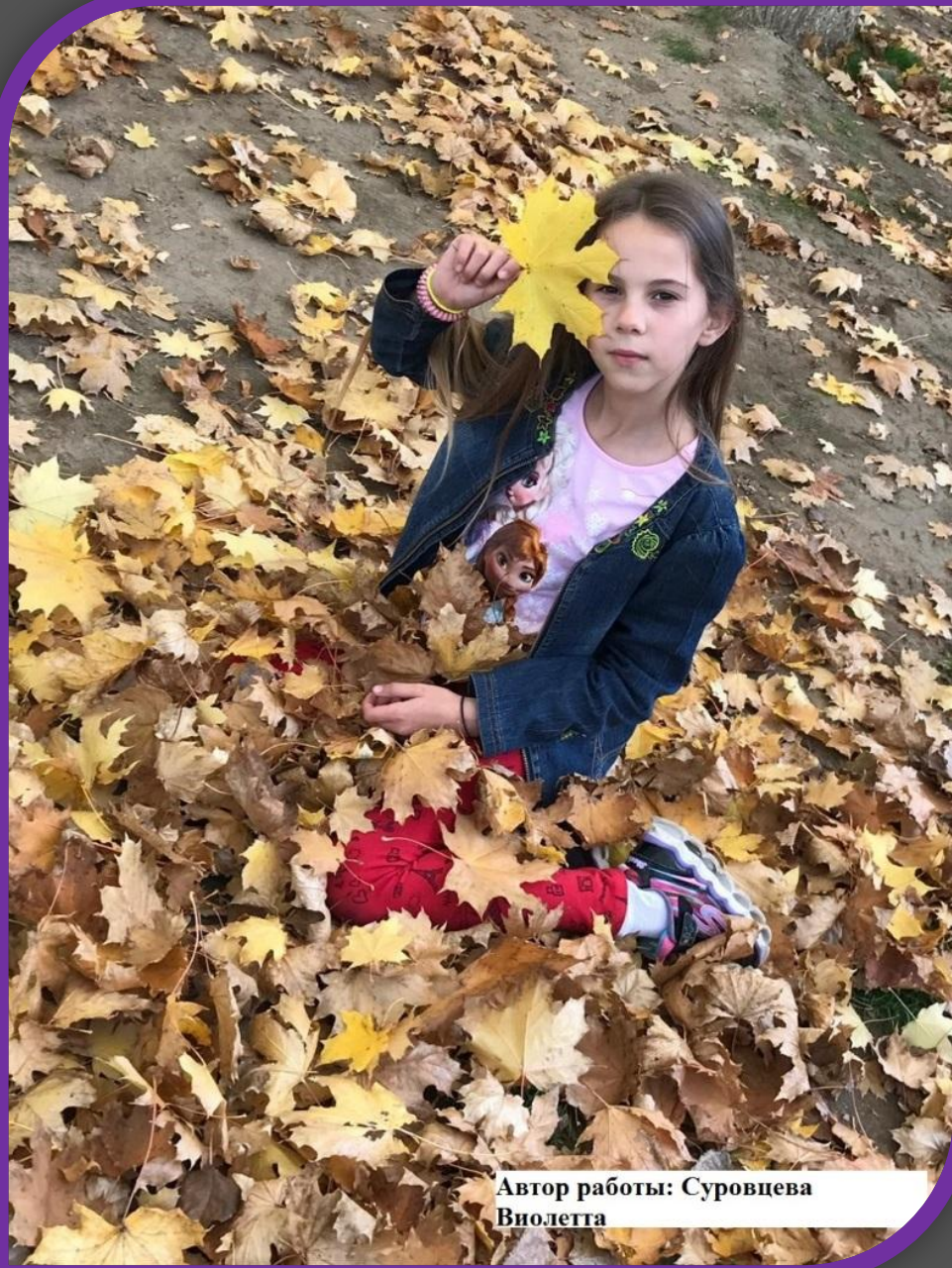
Автор работы: Суровцева Виолетта