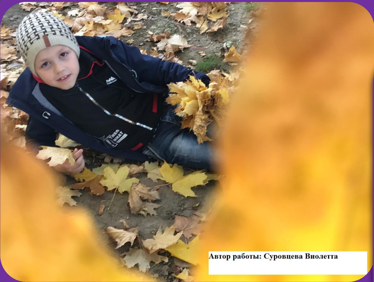
Автор работы: Суровцева Виолетта