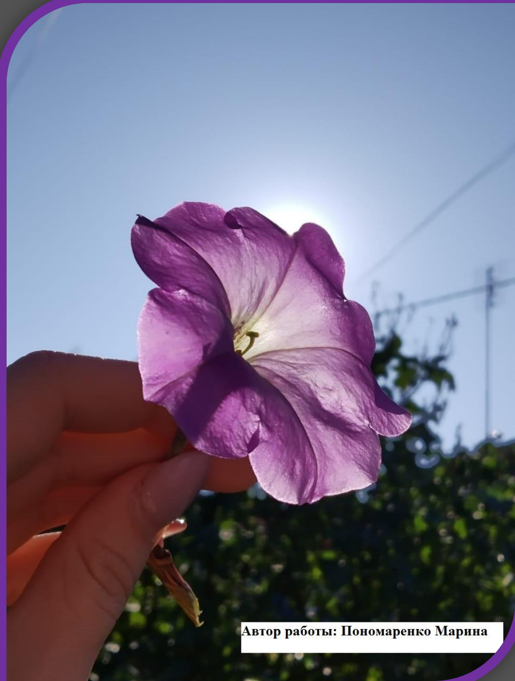
Автор работы: Пономаренко Марина