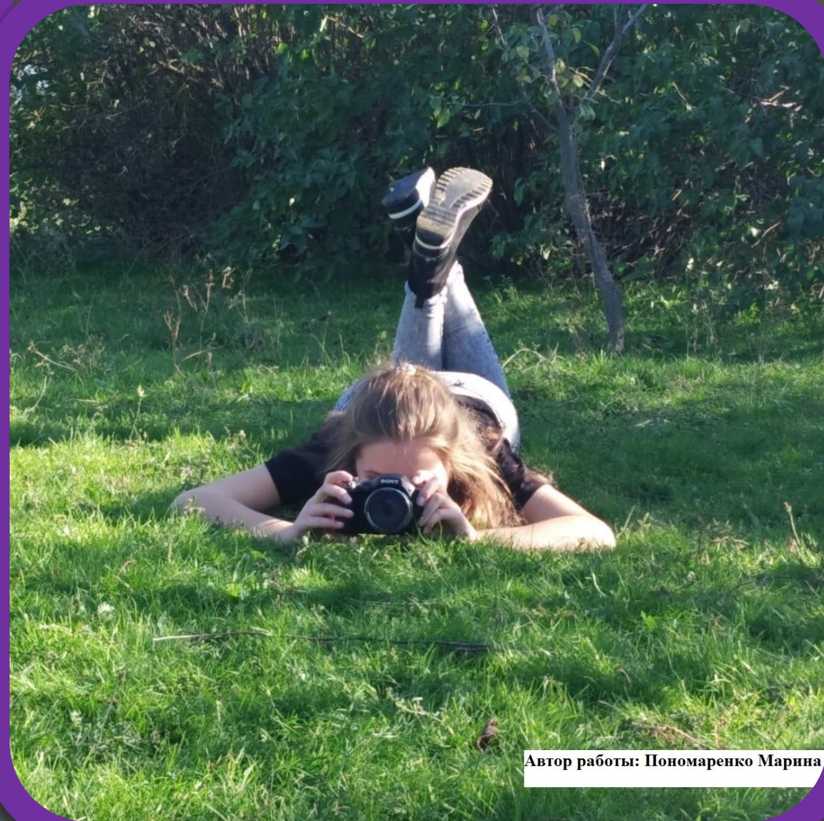
Автор работы: Пономаренко Марина