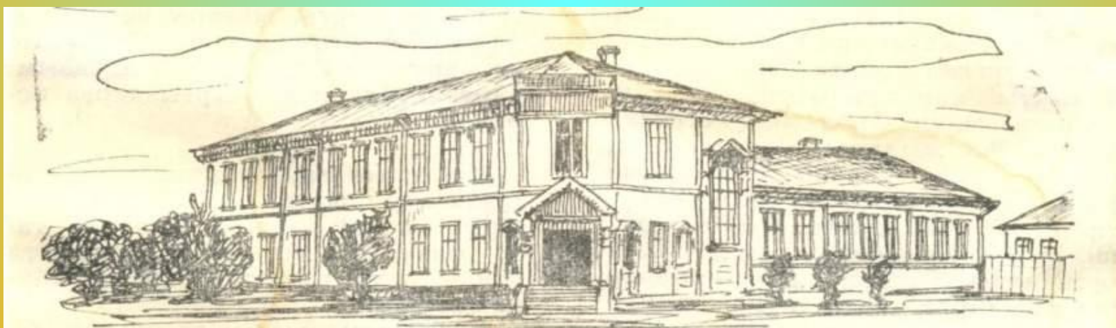
Орда қаласында 1901 жылы салынған екі кластық орыс-қазақ училищесінің үйі. (Қазіргі Орал облысының Орда ауданындағы Орда поселкесі).