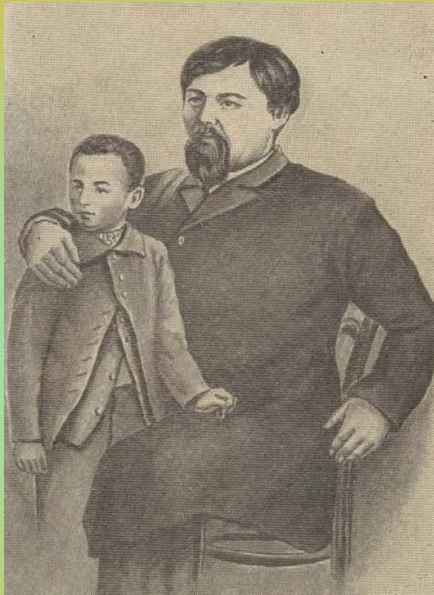
Ыбырайдың баласымен түскен суреті