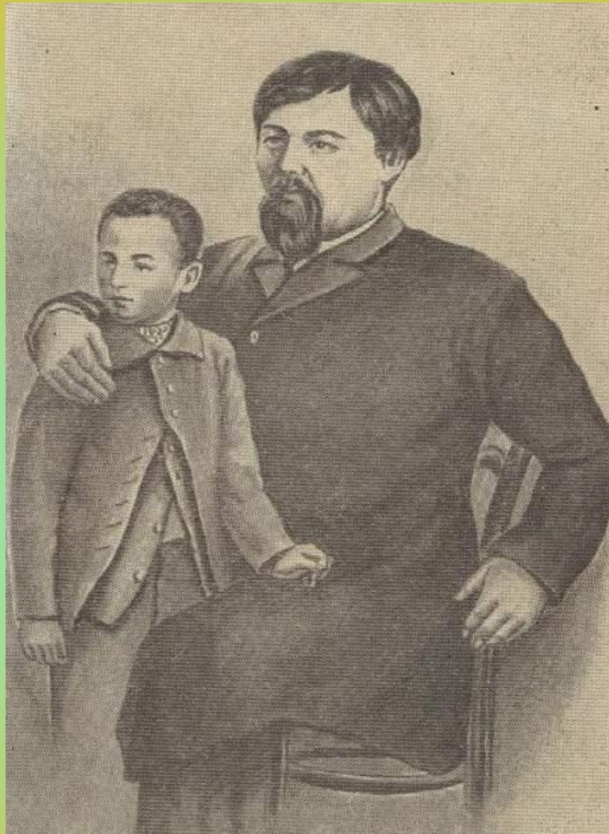
Ыбырайдың баласымен түскен суреті