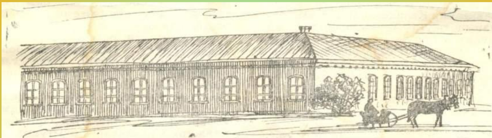
Қостанай қаласында 1890 жылдары ашылған орыс-қазақ училищесінің үйі.