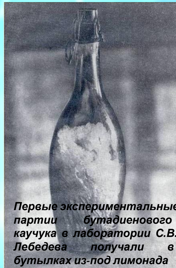
Первые экспериментальные партии бутадиенового каучука в лаборатории С.В. Лебедева получали в бутылках из-под лимонада

С 1914 г. начал работы по изучению полимеризации этиленовых углеводородов, которые легли в основу современных промышленных методов получения бутилкаучука и полиизобутилена.