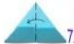
Схема сбора треугольного модуля