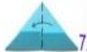
Схема сбора треугольного модуля