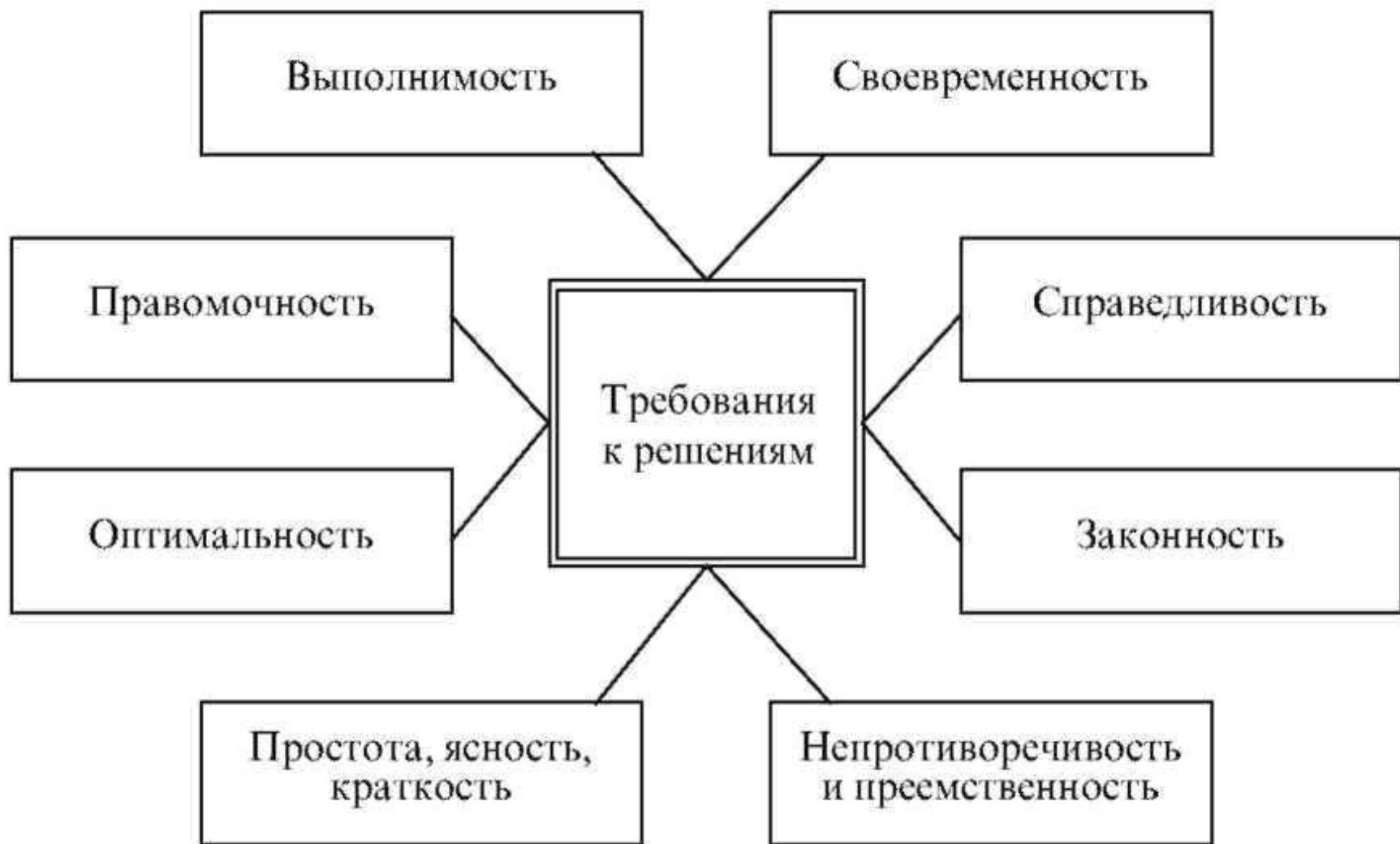
Рис. 37. Требования к управленческим решениям