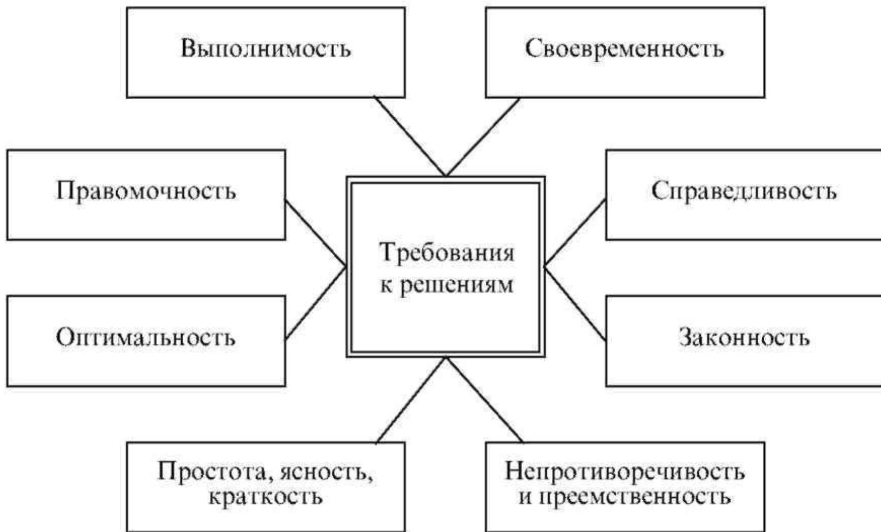
Рис. 37. Требования к управленческим решениям