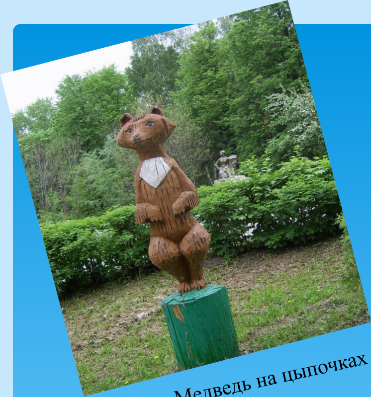
Медведь на цыпочках