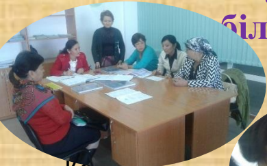
Коучинг тақырыбын анықтау