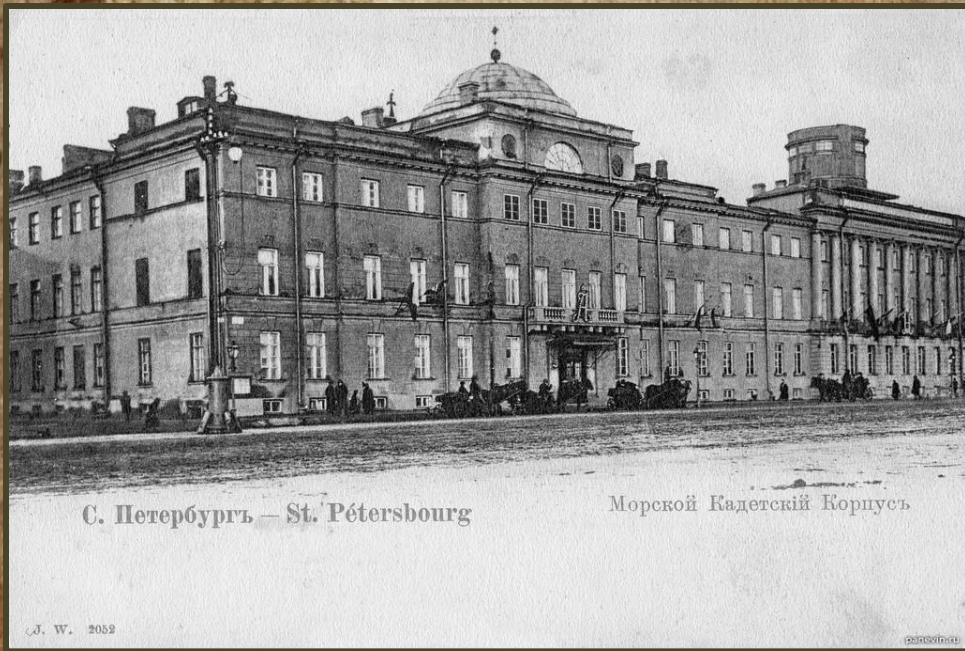
С. Петербургъ — St. Pétersbourg