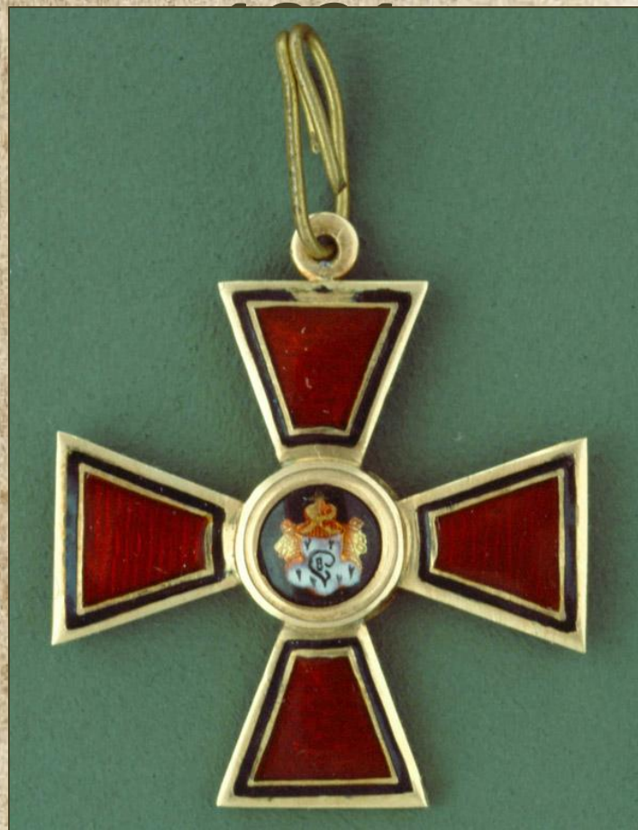
Орден св. Владимира