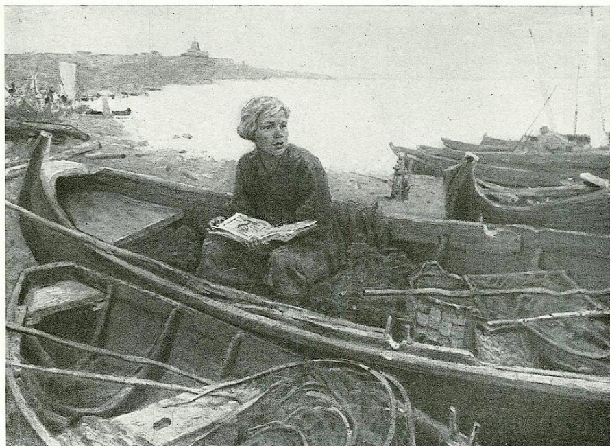
54. Ломоносов на родине. Картина О. А. Кочарова, 1954 г., холст, масло. Республиканский художественный музей. Кишинев (см. стр. 39).