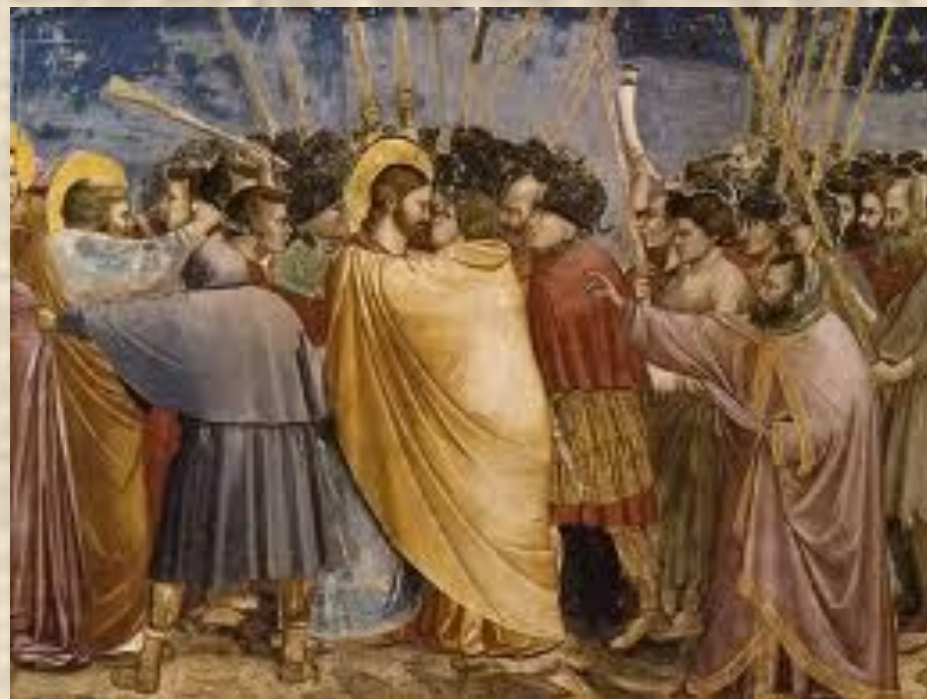
Джотто Поцелуй Иуды