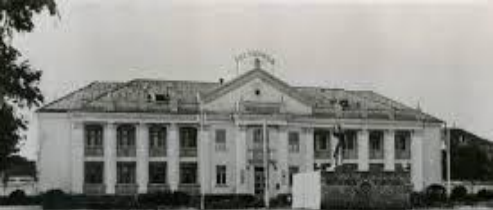
Площадь им. З. Батырмурзаева