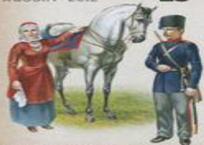
Енисейское казачье войско