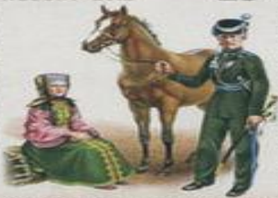
Оренбургское казачье войско