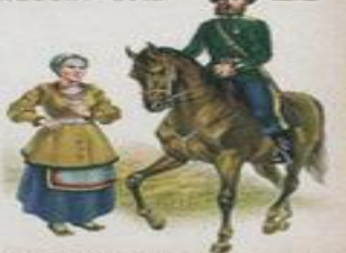
Уссурийское казачье войско