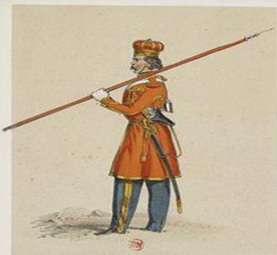
ESCADRON DE LA GARDE. (Cosaque de Crimée)