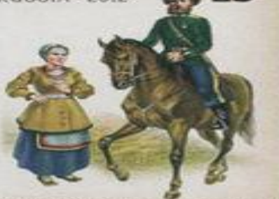
Уссурийское казачье войско