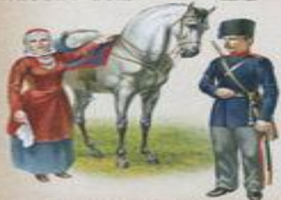
Енисейское казачье войско