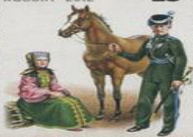
Оренбургское казачье войско