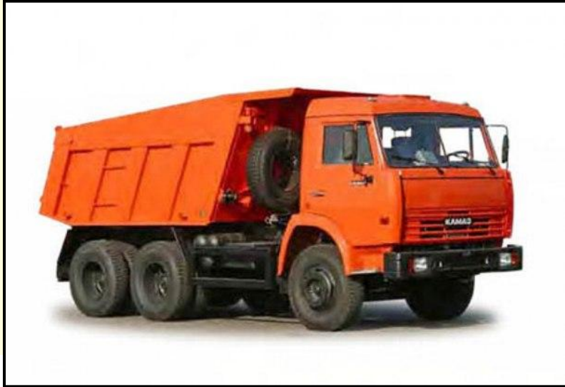
ГРУЗОВАЯ МАШИНА (ГРУЗОВИК)