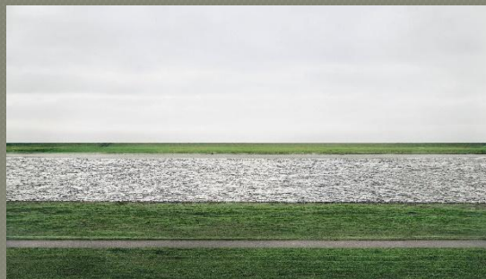
Андреас Гурски: «Рейн-II» ($4,33 млн.)