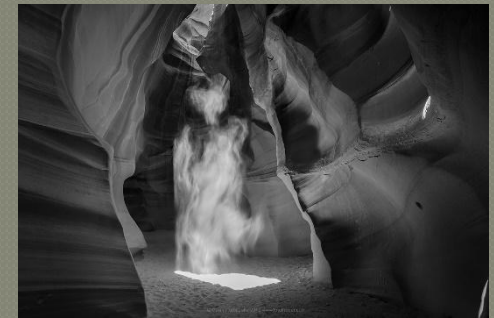
Питер Ликом: «Фантом» ($6,5 млн)