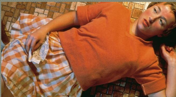
Синди Шерман: «№ 96» ($3,89 млн.)

Вы знаете, что художественной фотографией можно заработать приличные деньги. Факты? Пожалуйста: фотография, сделанная немецким фотохудожником Андреасом Гурски в 1999 году был продан на аукционе Christie's в Нью-Йорке за 4,3 миллиона долларов, что делает его второй самой дорогой когда-либо проданной фотографией. Делайте выводы, друзья!