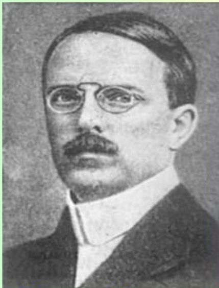
Клеменс Пирке австрийский педиатр (1874 - 1929)

это повышенная чувствительность человека к окружающим его веществам, передающаяся по наследству и способная вызвать определенные, называемые аллергическими, заболевания.