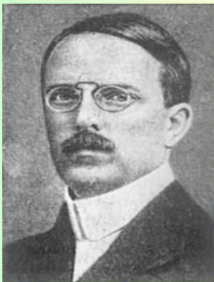
Клеменс Пирке австрийский педиатр (1874 - 1929)

это повышенная чувствительность человека к окружающим его веществам, передающаяся по наследству и способная вызвать определенные, называемые аллергическими, заболевания.