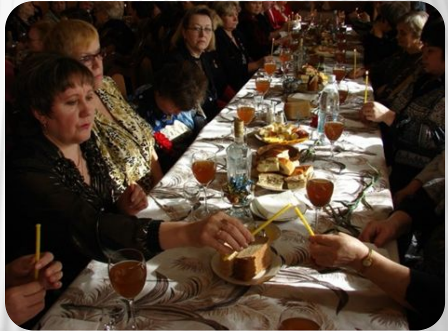
Фото: Традиции и обычаи русского народа. Поминки

Во время обряда все присутствующие за столом вспоминают усопшего добрым словом. Поминки принято проводить непосредственно в день похорон, на девятый день, на сороковой день и спустя год после смерти.