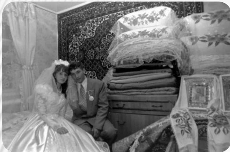
Фото: Традиции и обычаи русского народа. Свадебные обычаи

После принятия положительного решения относительно бракосочетания молодых, возникает вопрос подготовки приданого невесты. Обычно приданое готовит мать девушки. Оно включает в себя постельное белье, посуду, предметы обстановки, одежду и т.д. Особенно богатые невесты могут получить от родителей машину, квартиру или дом.