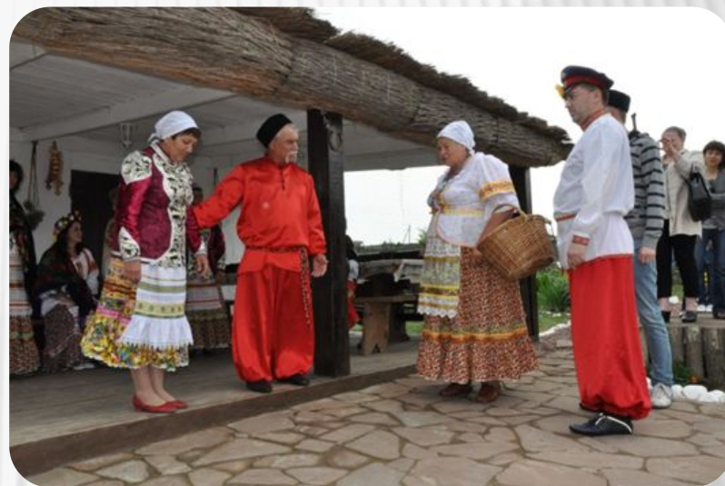
Фото: Традиции и обычаи русского народа. Свадебные обычаи

После того, как молодой человек принял решение о выборе кандидатуры в спутницы жизни, возникает необходимость проведения сватовства. Данный обычай подразумевает нанесение визита женихом с его доверенными лицами (обычно это родители) в дом к невесте. Жениха с сопровождающими его родственниками встречают родители невесты за накрытым столом. Во время застолья принимается совместное решение о том, состоится ли свадьба между молодыми.