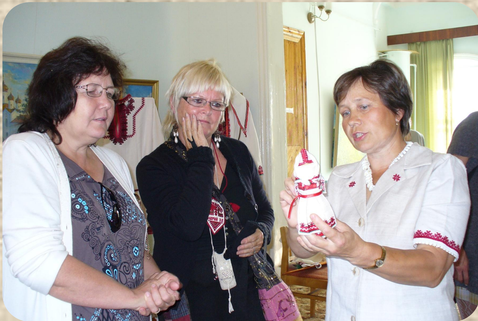
Встреча с финнами в Сернурском историко – литературном музее имени А.Ф.Конакова.