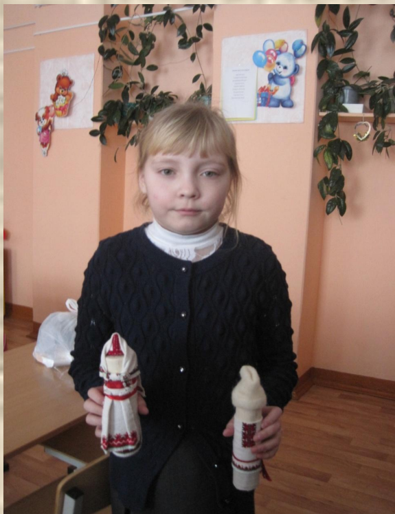
Пупашкар - куклы