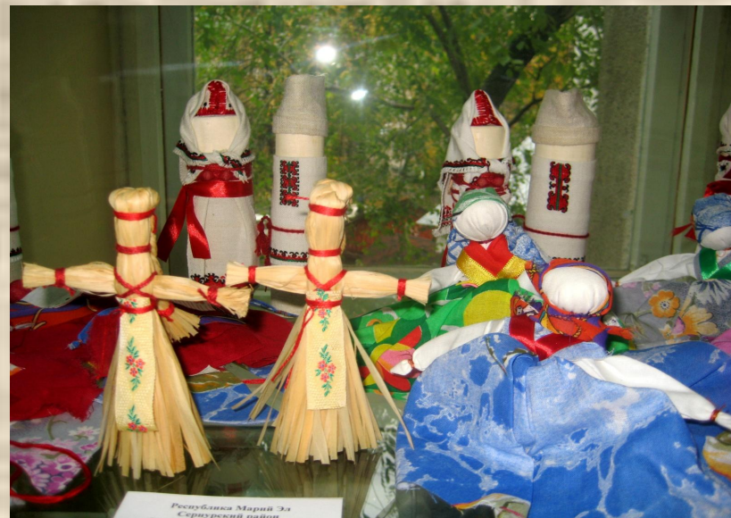
Республика Марий Эл Сяррурский район