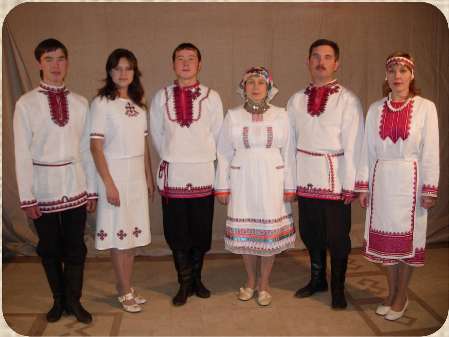
Межрегиональный фестиваль национального костюма «Марий вургем пайрем унала ужеш» 2002, 2003, 2005, 2007, 2009 год.