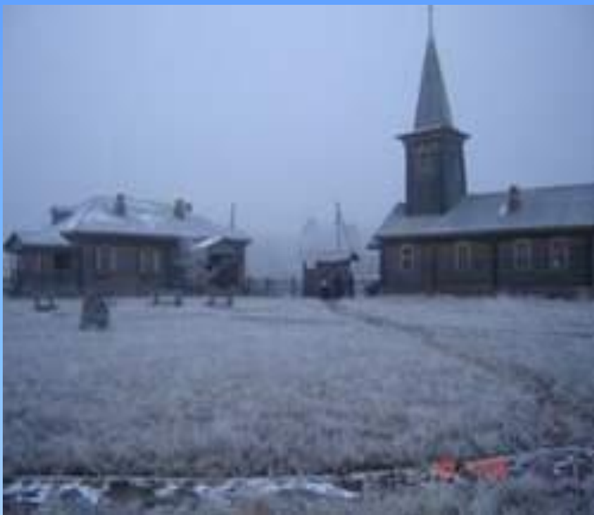
Сырымбеттегі мұражай (Көкшетау)