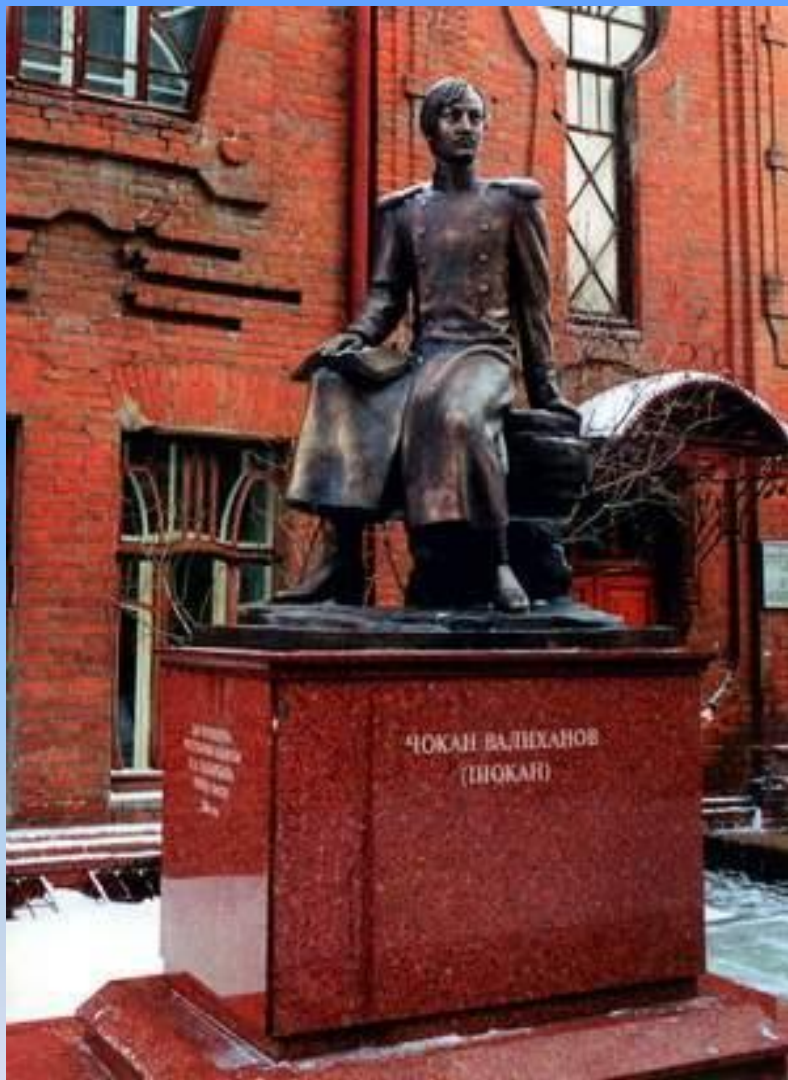
Омбы қаласындағы ескерткіш, көше аты Ш.Уәлиханов атында. 2004ж қойылған.