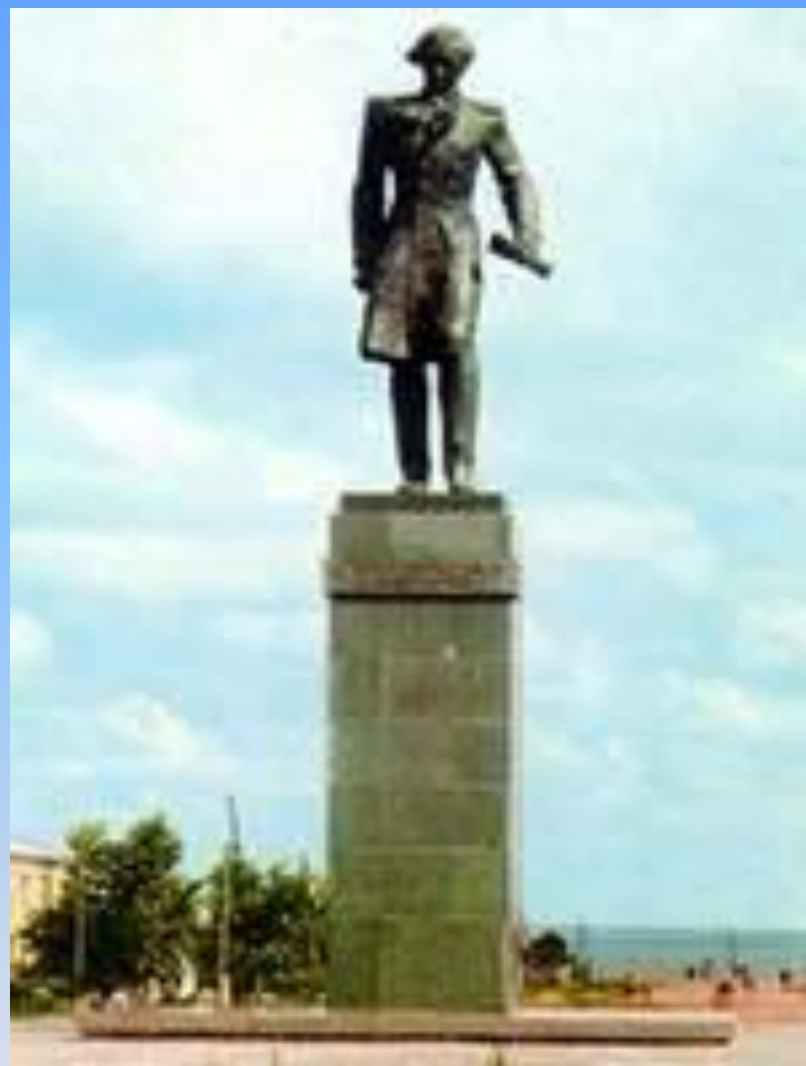
Көкшетау қаласындағы ескерткіш