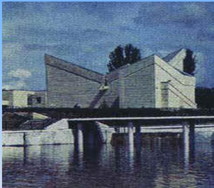
Алтынемелдегі мұражай (Қостанай)