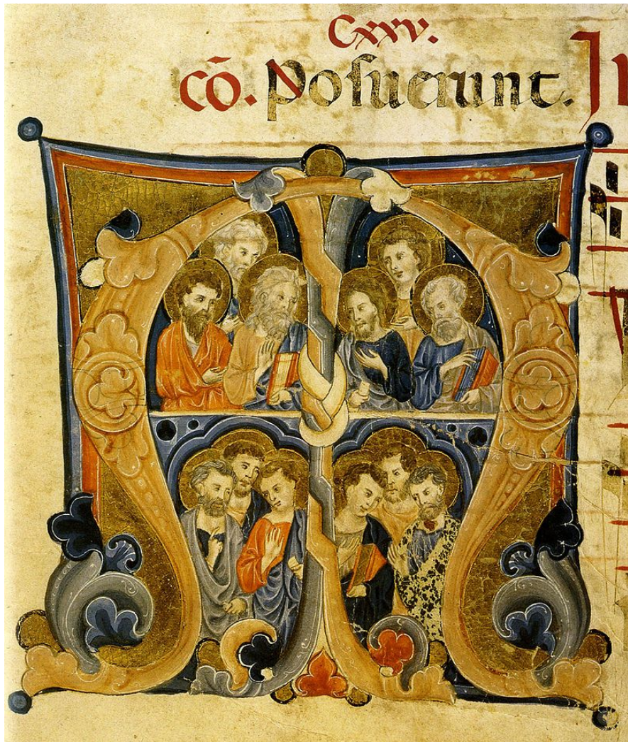
Двенадцать апостолов (книжная миниатюра, XIII век)

Двенадцать апостолов (греч.. απόστολος - «посол, посланник») - ближайшие ученики Иисуса Христа .