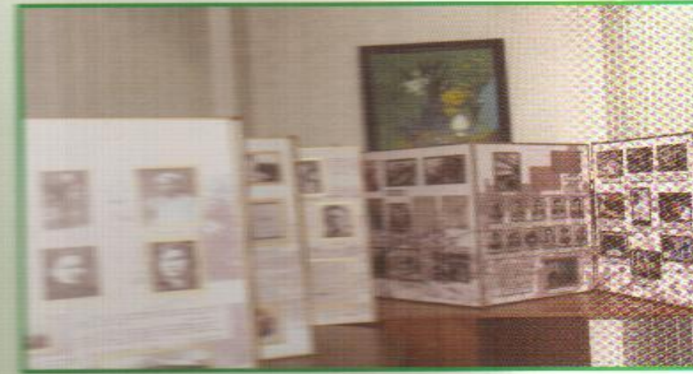
Музей-фатирда бештырылган күчмә күргәзмә.