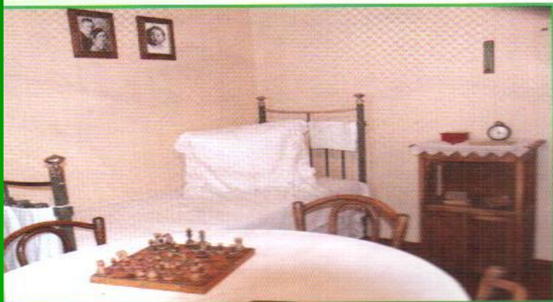
Музей-фатирга шагыйрь үзе кайтып керер төсле.