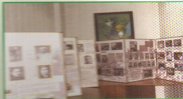
Музей-фатирда оештырылган күчмә күргәзмә.