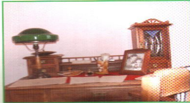
Шагыйрьнең эш өстәле.