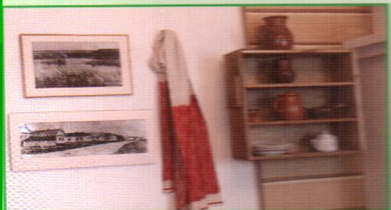
«Мусаларда кунакта» дигән күргәзмәдән бер күренеш.