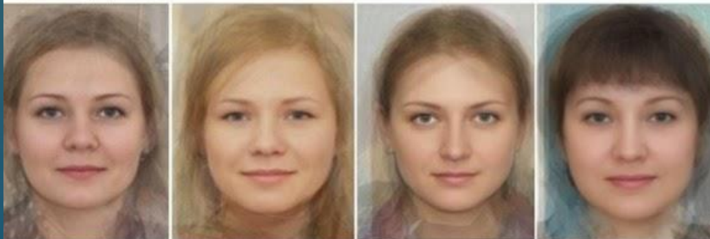
ЗАПАДНЫЙ БАЛТИД (Польша, страны Балтии и Беларусь)