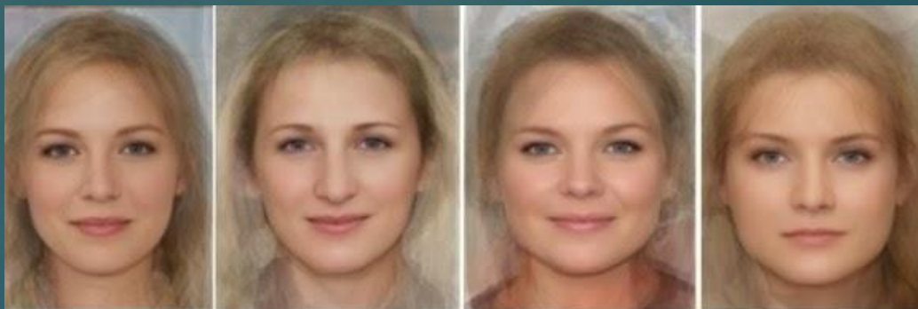
ВОСТОЧНЫЙ НОРДИД (западная Россия, Восточная Европа)