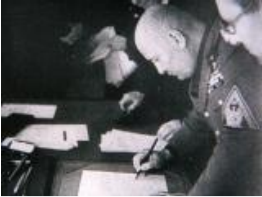
Б. Муссолини подписывает Мюнхенское соглашение 29 сентября 1938 года