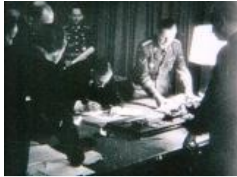
Н. Чемберлен подписывает Мюнхенское соглашение 29 сентября 1938 года