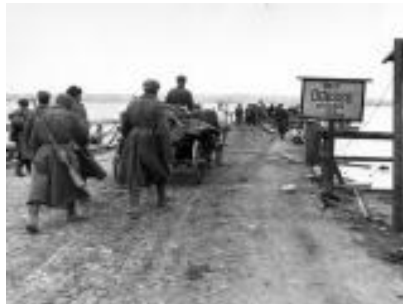
Советские бойцы по мосту переправляются через реку