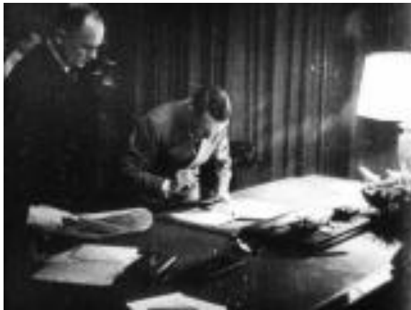
А. Гитлер подписывает Мюнхенское соглашение 29 сентября 1938 года

Ставить СССР и гитлеровский Третий рейх на одну доску могут только нездоровые либо невежественные люди. Великобритания и Франция ещё в 1938 г. подписали с Германией договоры, аналогичные советско-германскому; были к этим договорам и секретные дополнительные протоколы. Подписали с Германией такие договоры и страны Балтии. Однако им это никто не ставит в вину.