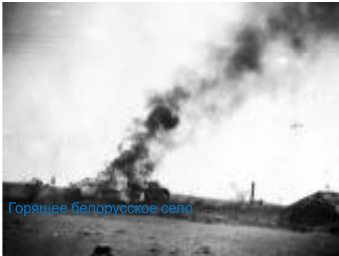
Горящее белорусское село

У. Черчилль 25 февраля 1945 г. заявил: «Будущие поколения будут считать себя в долгу перед Красной армией столь же безоговорочно, как и мы, которым довелось быть свидетелями этих великолепных подвигов»