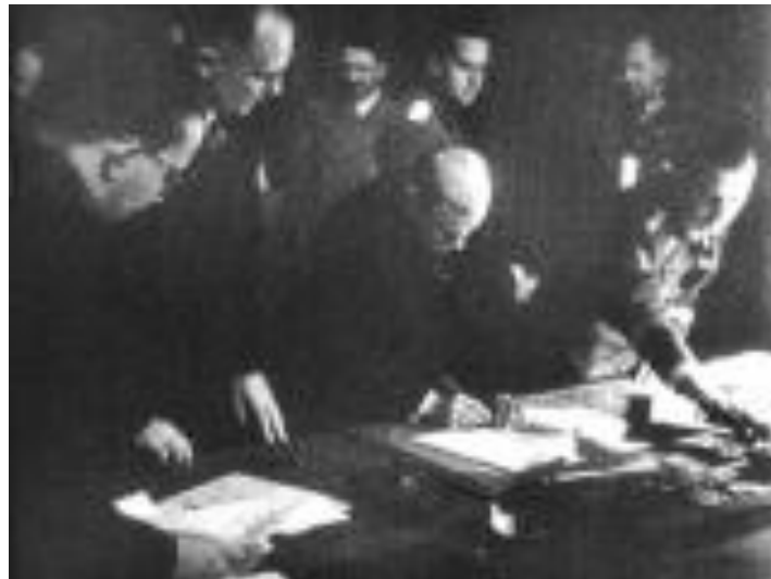
Э. Даладьё подписывает Мюнхенское соглашение 29 сентября 1938 года